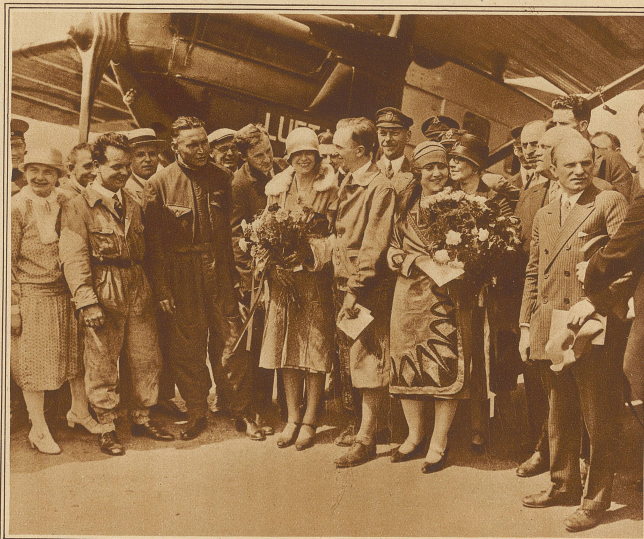
Chamberlin und Levine, die beiden kühnen Ozeanflieger, reisten nach Bremen, um ihre zu Schiff angekommenen Frauen in Empfang zu nehmen. Levine hatte seiner Frau bekanntlich die Absicht, sich am Fluge zu beteiligen, verheimlicht, so daß sie erst durch die Zeitungen von seiner „Flucht“ erfuhr. Das Wiedersehen soll aber deshalb nicht minder herzlich gewesen sein