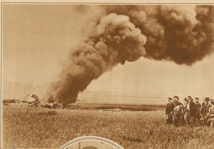
nach 10 km fing der Motor Feuer; die rasch vorgenommene Notlandung glückte und die Flieger konnten fliehen, bevor die 5000 Liter Benzin explodierten. Das Bild zeigt die Trümmer nach erfolgter Explosion