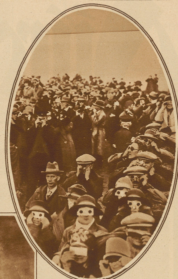
Eine originelle Gruppe von Beobachtern DIE SONNENFINSTERNIS vom 29. Juni