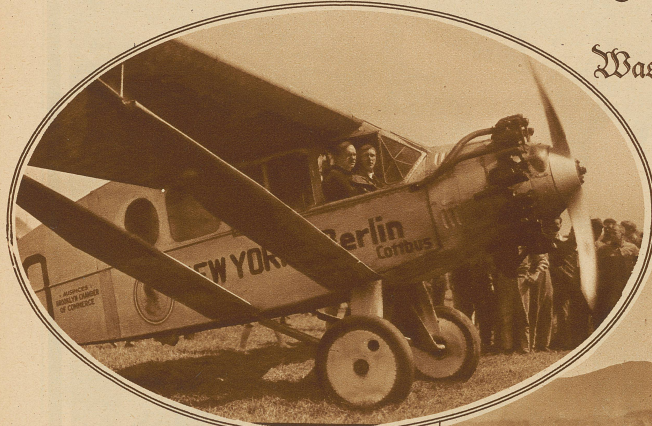
Die beiden Flieger bei ihrer Landung in Dübendorf