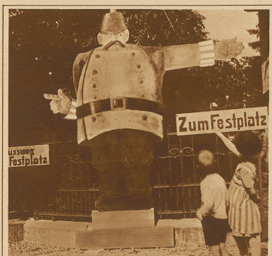
Bild links: Ein origineller Wegweiser am Thurg. Kantonschützenfest in Bischofszell