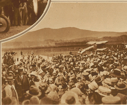
Der Empfang der Ozeanflieger in Thun