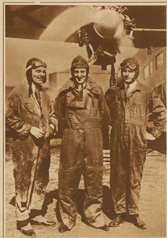
Auch Byrd hat den Ozean überflogen. Nachdem der Apparat schon Donnerstagabend 8 Uhr 30 die Stadt Brest überflogen hatte, war mit der Ankunft Byrds in Le Bourget um 10 Uhr zu rechnen. Doch infolge des strömenden Regens, der in der finstern Nacht jede Sicht verhielt (der Kompass funktionierte nicht mehr), verlor der Flieger die Orientierung und landete schließlich nach langem Suchen, nachdem er schon um 3 Uhr morgens die Gegend von Paris überflogen hatte. Freitag früh 5 Uhr 45 bei Verano-Meer zwischen Cherbourg und Le Havre, etwa 800 Meter von Strande entfernt, auf dem Meere, Byrd und seine Begleiter Neville (links) und Bennett (rechts) schwammen ans Land