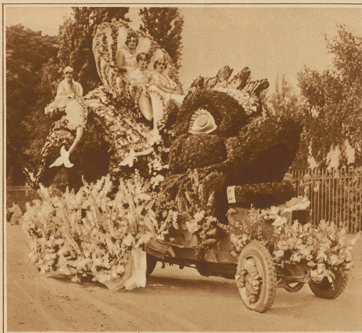
Ein glücklicher Delphin führt seine charmanten Sirenen spazieren