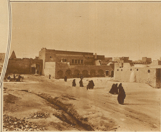
Vor den Mauern von Mossul