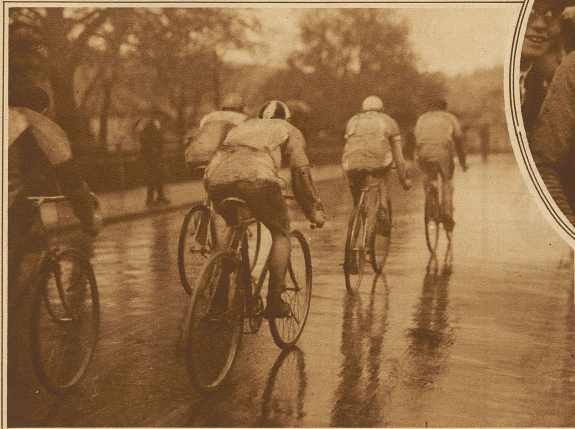
Die Kopfgruppe vor Olten