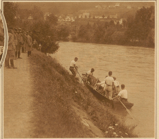
Pont.-Komp. 7 beim Bootfahrenbau