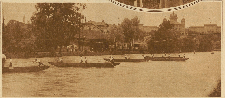
Sektion «Basel Gente» beim Sektionswettfahren