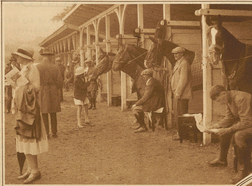
Blick in die Boxen am Sattelplatz