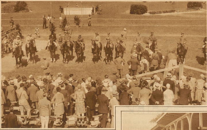
Preisverteilung im Preis vom Rigi