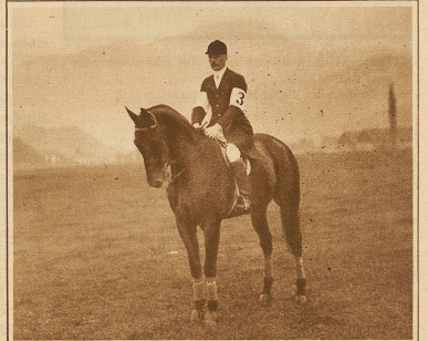
Prinz Sigismund von Preußen, der noch am Samstag und Sonntag die olympische Vielseitigkeitsprüfung gewann, stürzte beim Training auf der Luzerner Almend derart unglücklich, daß er am Mittwoch verschied