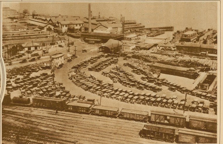
Blick auf den großen Automobil-Parkplatz von Weehawken, wo die auswärtigen Geschäftsleute von New York jeden Morgen ihr Auto zurücklassen, um sich durch eine Fähre zur Stadt übersetzen zu lassen