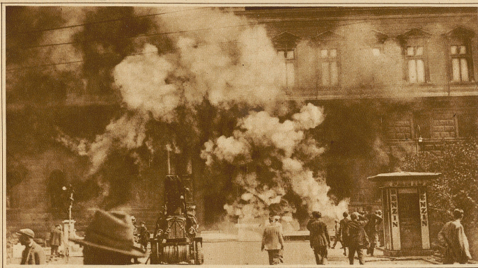
Das erste Feuerwehrauto vor dem brennenden Justizpalast