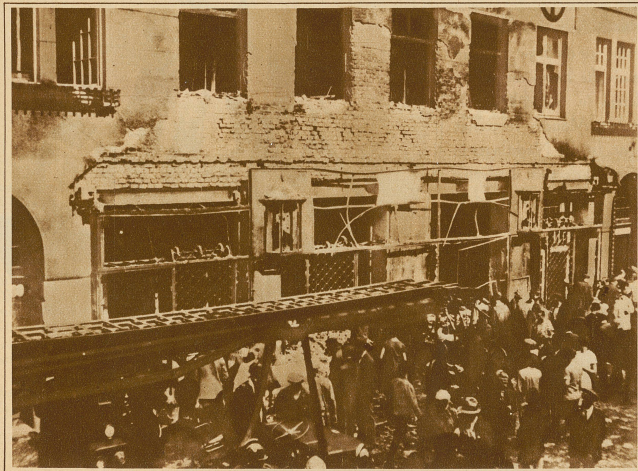
Die demolierte Redaktion der »Reichspost«