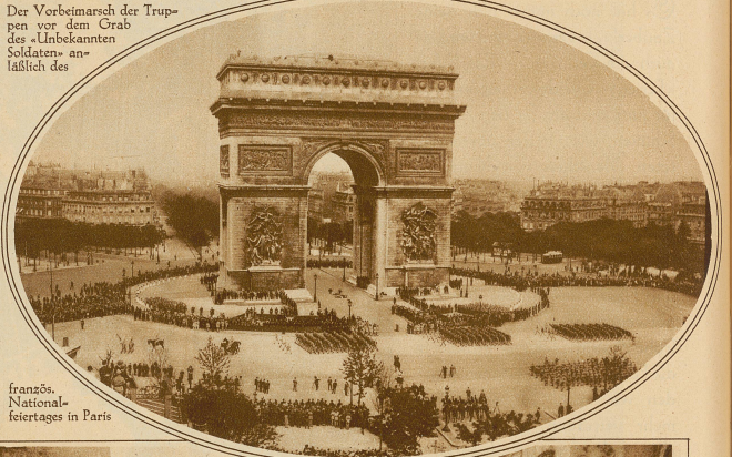
französ. Nationalfeiertages in Paris