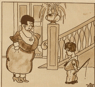
«Habe ich dir nicht gesagt, du sollst aufpassen, wenn die Milch überkocht?» «Das habe ich ja getan, Mutter: es war genau halb elf.»

Definition. «Vater, was ist das Echo?» «Das einzige Wesen, dem es gelingt, das letzte Wort zu haben, wenn deine Mutter gesprochen hat.»