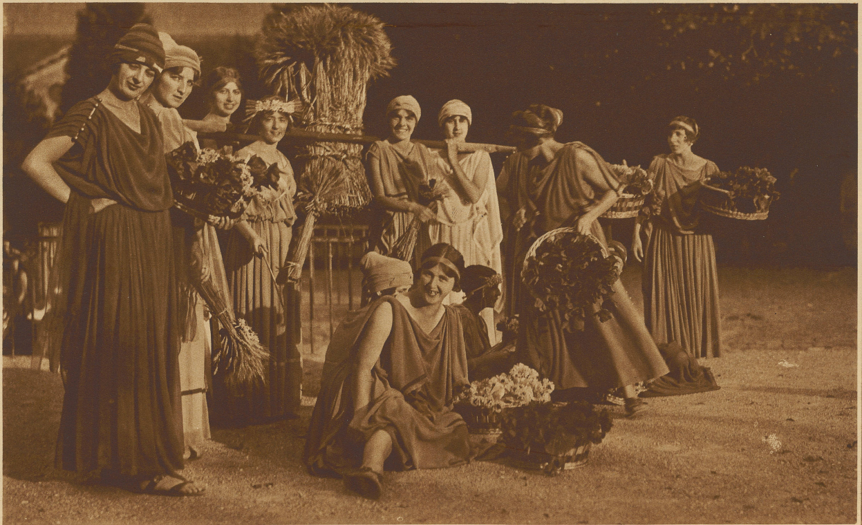
DAS WINZERFEST IN VEVEY

Oberes Bild: Eröffnungsszene. Unteres Bild: Aus dem Gefolge der Ceres