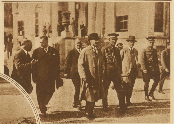
Mustapha Kemal Pascha, der türkische Staatspräsident, hat dieser Tage zum erstenmal seit seines Regierungsantrittes die Stadt Konstantinopel besucht. Unser Bild zeigt ihn (im grauen Mantel) bei der Besichtigung der Stadt