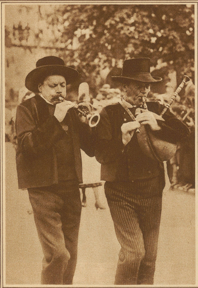
Bretonische Bauertypen auf einem Volksfest in Quimper