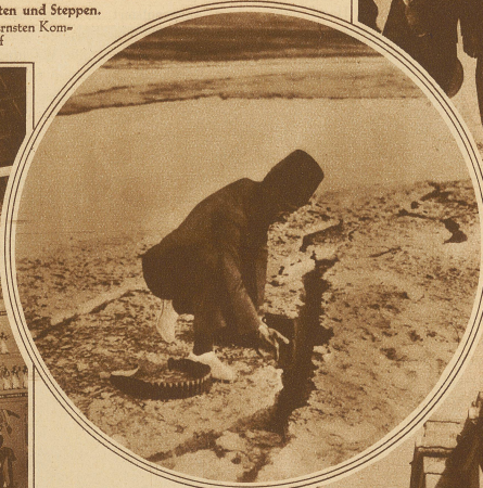
Während des Erdbebens entstanden längs des Jordans kilometerlange Risse im Boden