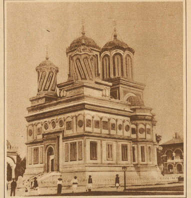
Die aus dem 15. Jahrhundert stammende berühmte Kathedrale von Curtea de Argeș, wo der verstorbene König von Rumänien beigesetzt wurde