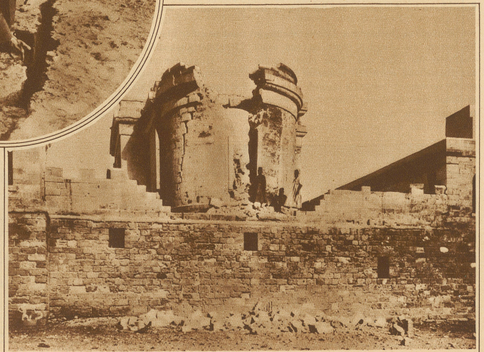
Bild rechts: Die Kirche St. John, deren Turm in zwei Hälften gespalten wurde und einstürzte