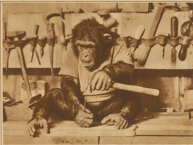
Ein gelehriger Schreiner

Am nächsten Tage begegnete der eine der beiden Rivalen einem Bekannten. Seine trübe Miene war auffällig. Darüber befragt, sagte er seufzend: «Ich habe verloren: ich muß sie heiraten.»