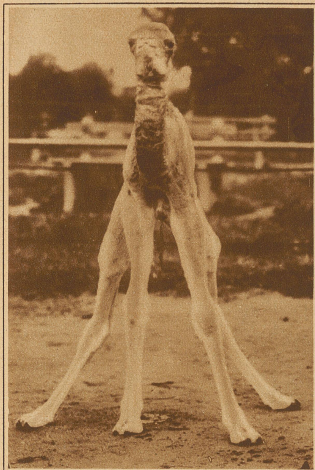
Wie ein junges Kamel aussieht