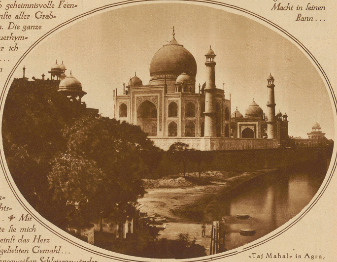
«Taj Mahal» in Agra, das schönste Grabmal der Erde

ring herein und wob geheimnisvolle Feenschleier um das schönste aller Grabdenkmäler auf Erden. Die ganze Natur schien eine Trauerhymne anzulimmen, der ich tief ergriffen laulchte... Auf Ewigkeitsflügeln drang vom Jenseits eine verlorene Melodie herüber, mir ist, als schwebten süße Harfenklänge an mein Ohr. Im Geiste sah ich jene wunderkühne Prinzessin, die seit Jahrhunderten hier schlummert. Durch das entseelte Traumreich läufern Sehnluchts-