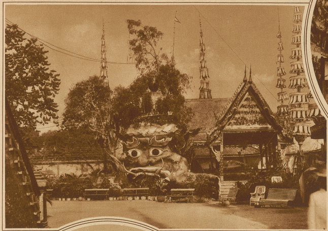
Seltsamer Aufbau bei einer Leichenverbrennung in Bangkok

Das Schönste, was ich je auf Erden gesehen, ist der «Taj Mahal», jener wunderbaren innerung... Die letzten Strahlen der untergehenden Sonne Indiens zauber-