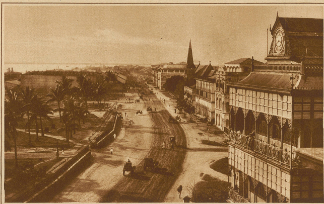
Die Strandstraße in Rangoon

tenrolige Farbenphantasien auf das Marmorwunder. In den dunkeln Cypressen, die wie eine stille Ceilsterwache am Ufer der heiligen Gewässer stehen, sang der Abendwind ein Klageleid. Schleierleicht breiteten Mangnolien ihre Märchenblüten, große, bunte Schmetterlinge umtaumelten die tropischen Boskette und ein Duft aus fremdem, nie gekanntem Land erfüllte die Luft. * Schnell, wie stets in Indien, brach die Dämme-