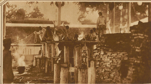
Gießen einer Buddhafigur

Wie eine märchenhafte Fata Morgana, die im seidig blauen Aether schwebt, heben sich seine schimmernden Kuppeln und Türmchen vom klaren, wolkenlosen Himmelszelt ab,