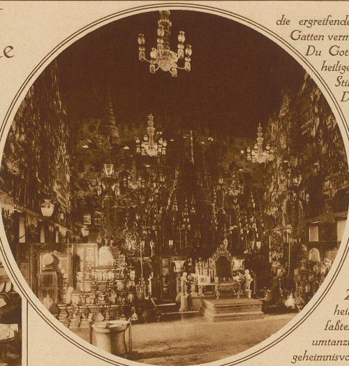
Das Innere des Königstempels, «Wat Phra Keo» mit der Figur des Smaragd-Buddhas auf der Spitze des Altars. Diese Figur bildet das köstlichste Kleinod des himmlischen Reiches

die ergreifende Totenklage des verlassenen Gatten vermeinte ich zu hören: «O Brama, Du Gott der Gläubigen, an Deinen heiligen Teichen erhebe ich meine Stimme, daß ihr Gewässer sie zu Dir trage. Höre Brama, sie, die Einzige, die Geliebte meines Herzens, hat eine Welt verlassen, sie sing aus meinem Leben und ich lehe nicht mehr ihre Augen, ich höre nicht mehr ihre süße Stimme... o Brama! sie lieb mich ganz allein mit meinem Leid... * Traumverloren hatte ich gelaucht. Feuerlich drang das tiefe Raulchen der Cypresse in die erhabene Stille. Zierliche Elfen liehen den heiligen Teichen zu entleeren, labten sich an den Händen und umtanzten den lichten Totentempel in geheimnisvollem Reizen. Funkelnde Dementen blühten in ihren flimmernden Haaren, oder es waren leuchtende Glühwürmchen. Leise sangen sie der toten «Rani» ein Schlum-