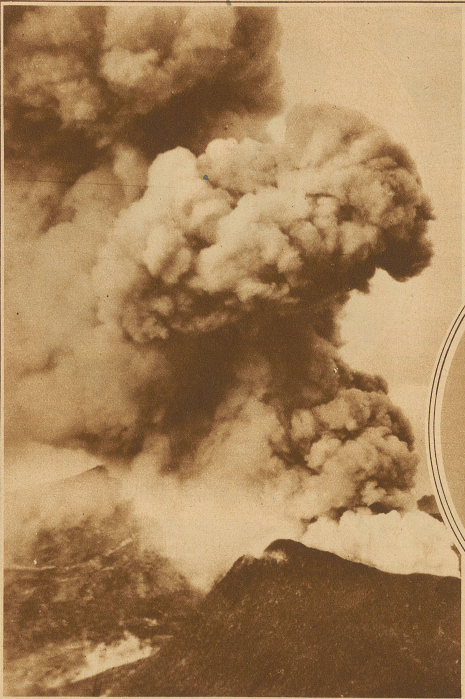
Der Gipfel des Vesuvius während seines neuesten starken Ausbruches