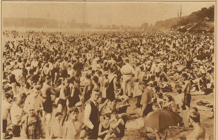
70000 Menschen baden an einem Sonntag im Bad Wannsee bei Berlin