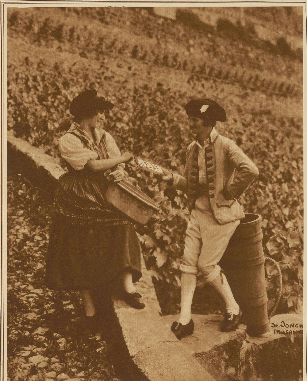
Das Winzerfest in Beven 1927 und die Milch-Chocolate Cailler

Was der Rost dem Eisen, das ist der Neid dem Menschen