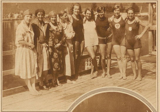
Die Teilnehmerinnen an den Damenkonkurrenzen Schweiz, Schwimm-Meisterschaften in Arosa