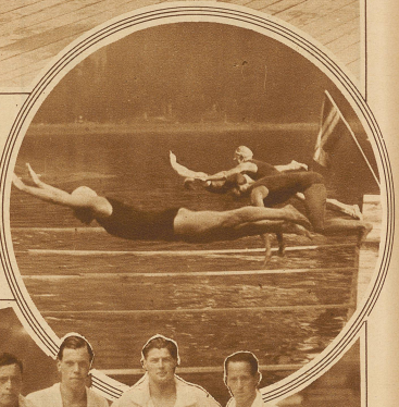
Start zum Ausscheidungsschwimmen für den Länderwettkampf gegen Deutschland