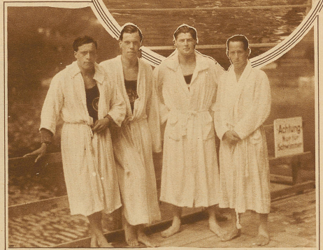
Gebr. Versaz, Holzer und Bignoni, die vier Ersten der 1500 m Herrenmeisterschaft