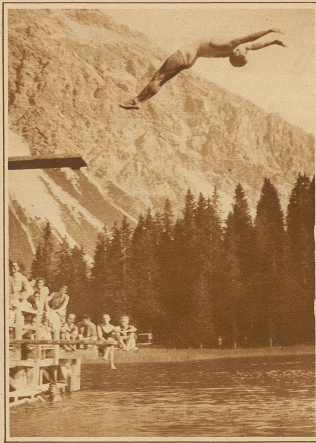
Ein prächtiger Sprung