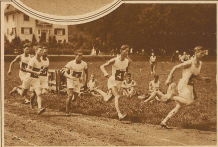
Kantonaler Leichtathleten-Turntag in Oerlikon. Moment aus dem 600 m-Lauf