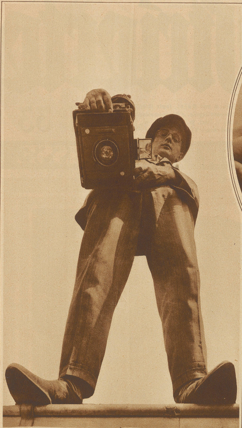
Selbstbildnis des Photographen aus der Regenwurm-Perspektive Bild rechts: Der Mann mit dem größten Motorrad