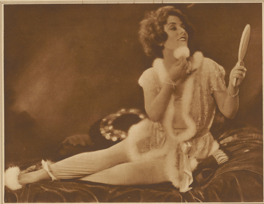
Die Filmschauspielerin Ruth Weyher bei der Morgentoilette

«Verschwunden, getötet! Fand man ihre Leichen?»