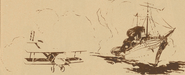
Die Geschwindigkeit eines Flugzeuges

Kein anderer Wagen hat alle diese Eigenschaften aufzuweisen