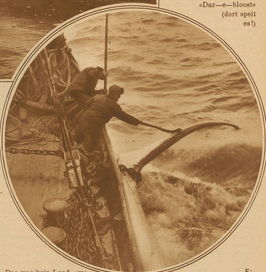
Ein gefangener Wal wird am Schiffsrumpf befestigt

Eines Tages durchfuhr mich ein furchtbarer Schrei vom Mastkorb her. «Dar—e—bloost» (dort speit es!)