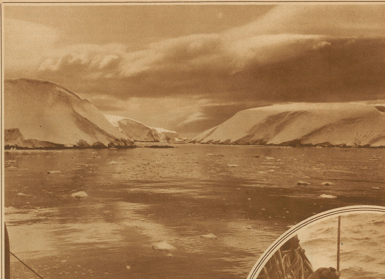
Im Roald Amundsen-Hafen auf den South Shetlands-Inseln

Schon der ungeheure Walkörper bietet einen imposanten Anblick. Vor wenigen Stunden schwamm dieses Tier noch lebend im Meere, schien in seiner gigantischen Größe unanfechtbar, gefeit gegen alle Gefahren, die in der Seetiefe lauern. Und doch war er unterlegen, bemeistert von den kleinen Jägern, die allen Schrecknissen von Wetter, See und Wildheit widerstehen, um diesen gewaltigen Tierleib der Menschheit nutzbar zu machen. Welche Urkraft und Anspruchslosigkeit ist diesen Männern eigen! 99% der Durchschnittsmenschen der Städte würden diesen harten Lebens- und Arbeitsbedingungen erliegen.