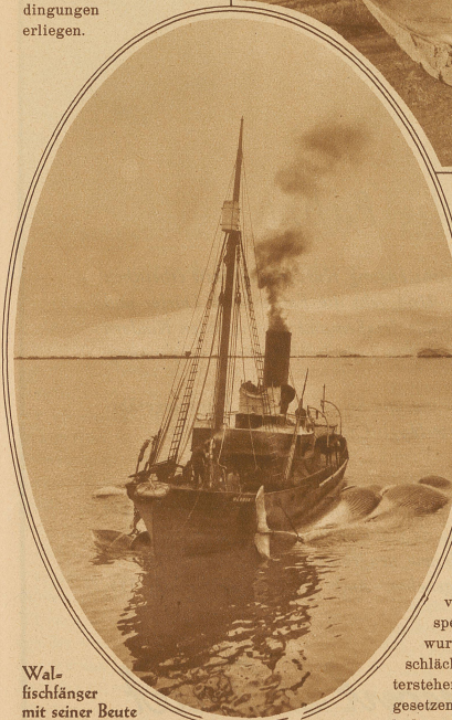
Walfischfänger mit seiner Beute

Grimmigster Kälte sind sie ausgesetzt, oft über und über mit Eis bedeckt und doch wie leistungsfähig, wie tätig und geschickt!