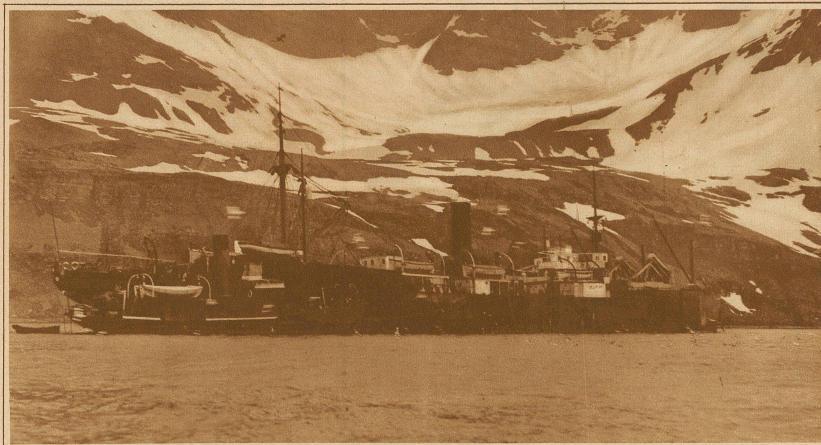
Das große Expeditionsschiff mit dem Walfischfänger an der Seite

die Erlegung des zweiten Wals vom ersten Schuß bis zum Ende drei Stunden beansprucht hatte, ein Zeichen der ungeheuren Lebenskraft dieser Tiere.