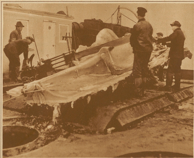
Zersägen des Walfischkopfes