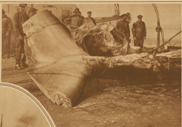
Die gewaltige Schwanzflosse eines Riesenwals

Fässer gebracht und vandsandbereit gemacht. / Der vom Fett entblößte Walrumpf wird inzwischen auf das Fleischdeck befördert behufs besonderer Behandlung. Das aus dem Fleisch gewonnene Oel dient zu Heilzwecken (Lebertran, Emulsion etc.), das Gerippe wird in der Hauptsache zu Knochenmehl (Dünger) verarbeitet. / Früher, als die Wale weit zahlreicher und die Maschinenteknik noch nicht so hoch entwickelt waren, verwendete man nur den Transpeck, die Ueberreste des Wals wurden beiseitegeworfen. Walschlächterei und -Großhandel unterstehen heute bestimmten Schutzgesetzen und der Kontrolle; diese bedingen eine ökonomische Verwertung.