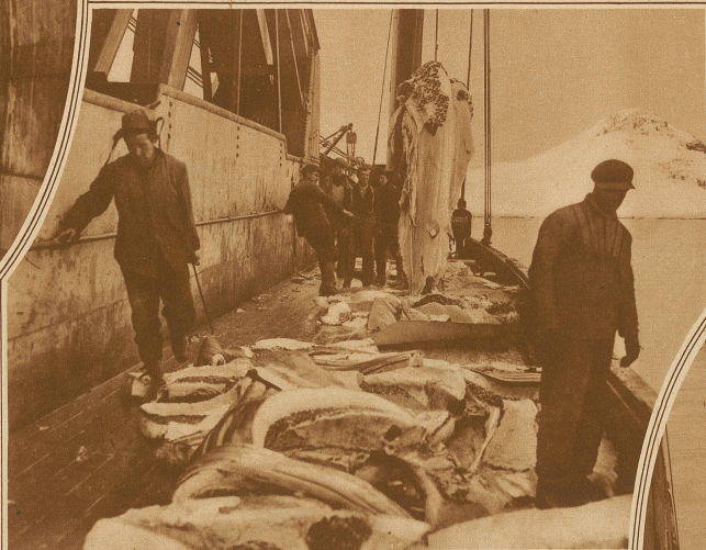
Zur Erleichterung des Auskochens werden die Speckseiten an Bord zerkleinert. Am Kran hängt die riesige Zunge

Höchst überrascht war ich, zu erfahren, daß