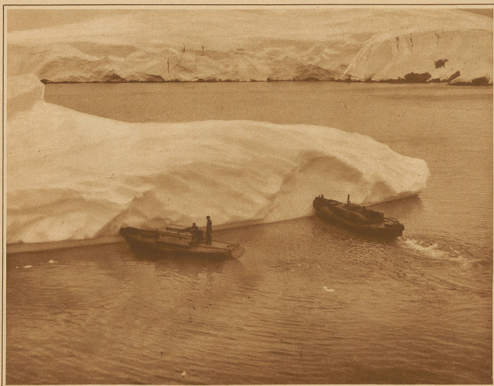
Zwei Motorboote schieben einen Eisberg weg

Fünf Tage nach unserer Abfahrt von South Georgia erreichten wir die South Shetlands-Inseln, meines Erachtens den trostlosesten Ort, den man sich vorstellen kann. Ausgezackte, mit Schnee und Eis bedeckte Felsen, nicht die geringste Spur von