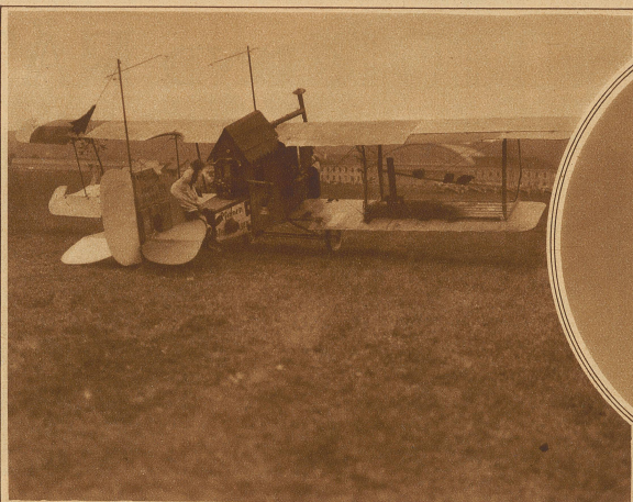
Das künftige Familienflugzeug für das Wochenende