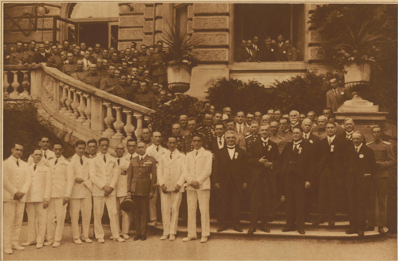
Empfang der fremden Delegierten und Flieger im Zürcher Kursaal