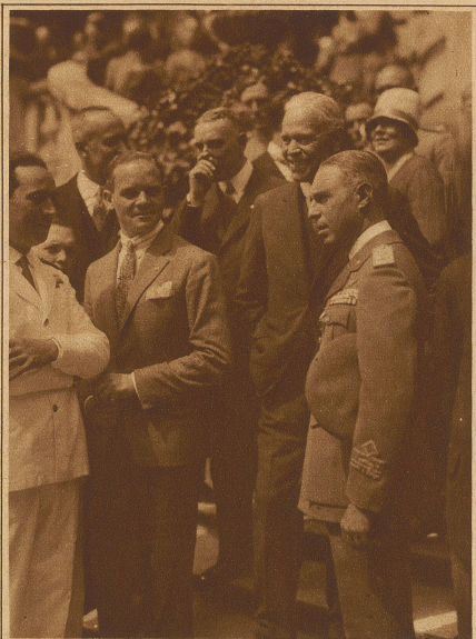
Der italienische Weltflieger, General de Pinedo, im Gespräch mit fremden Fliegerkameraden