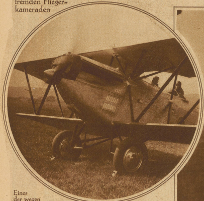
Eines der wegen ihrer Schnelligkeit bekannten italienischen Fiat-Flugzeuge mit 1350 P.S.