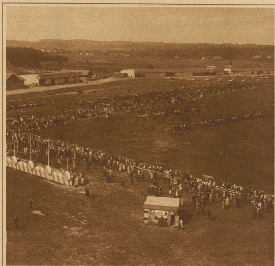
Blick auf das Flugfeld während des Meetings