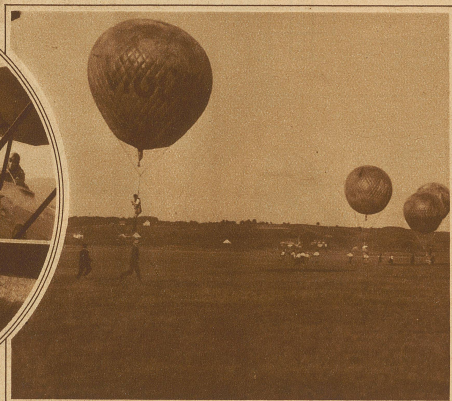
Moment aus dem Ballon-Springen