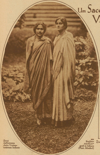
Zwei waldverwandte Vertreterinnen Indiens

Dieser Kriminalfall von ungeheurem Ausmaß beschäftigt die Gemüter nun schon mehr als sechs Jahre und immer lauter werden die Zweifel an der Stichhaltigkeit der zusammengeträgten Indizienbeweise, die zur Verhängung des Todesurteils über die beiden führten. Ob sie schuldig sind, läßt sich aus der Ferne nicht beurteilen. Aber soviel scheint festzustehen, daß der ganze Fall nicht einwandfrei abgeklärt ist. Schon aus diesem Grunde wäre eine Begnadigung, die überdies einem Gebote der Menschlichkeit entspräche, gerechtfertigt