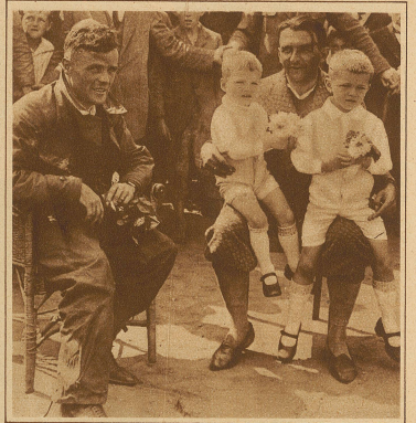
Die beiden deutschen Piloten Edvard und Ritter, die letzte Woche einen neuen Weltrekord im ununterbrochenen Dauerflug von 82 Stunden, 11 Minuten, 8 Sekunden aufstellten und nun einen Ozeanflug nach New York vorbereiten