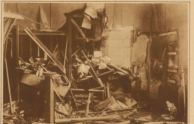
Das Bombenattentat in Basel. Blick ins Innere des demolierten Tramhäuschens nach der Explosion der Bombe, die in der Telefonkabine (rechts im Bilde) niedergelegt wurde