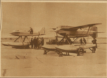
Zwei Wasserflugzeuge neuester Konstruktion der englischen Marine. Ueber den Bau dieser Apparate wurde bis jetzt peinlichstes Stillschweigen bewahrt