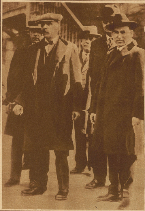
Sacco und Vanzetti (zusammengefesselt), die am 22. August hingerichtet werden sollen

Bild rechts: Originelle Straßenreklame auf den Pariser Boulevards. Der in eine echte mittelalterliche Rüstung gekleidete Mann trägt eine Damenledertasche in der Hand, die er von Zeit zu Zeit erhebt, um die Passanten auf die Verkaufsfirma aufmerksam zu machen