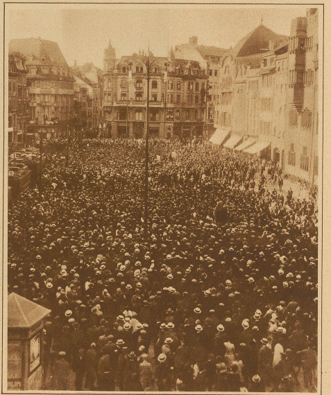
Die Demonstrationsversammlung auf dem Marktplatze in Basel während des einstündigen Proteststreiks