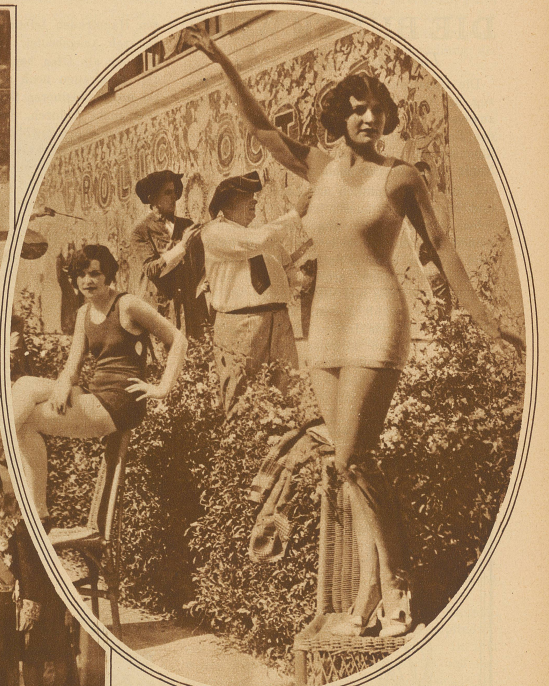
Bekannte Maler Californiens bemalen die Wände der Ausstellungsgebäude der im Oktober stattfindenden Kunstausstellung in Los Angeles mit Bildern schöner Californierinnen, die sich als Modelle auf offener Straße aufstellen