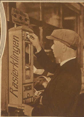
Ein Automat für Rasierklingen ist das Neueste, das gegenwärtig in Berlin zu sehen ist. Ob dieser bartlose Jüngling wirklich schon solche Klinsen braucht . . . ?