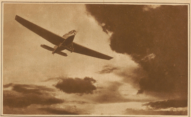
Die Sturmfahrt der «Bremen»