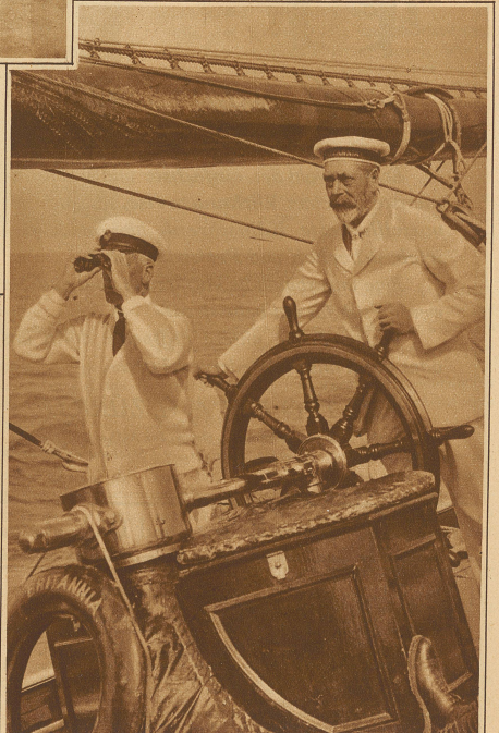
Der König von England am Steuer seiner Yacht «Britannia»