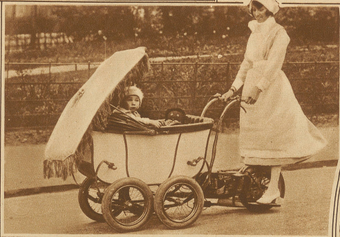
Der Motorkinderwagen mit dem führenden Kindermädchen - die neueste Erscheinung im Londoner Hydepark

Der deutsche Versuch der Ozeanüberquerung im Flugzeug hat ein vorzeitiges Ende gefunden. Nachdem die «Europa» schon nach kurzer Flugdauer in Bremen niedergehen mußte, ist auch das zweite Flugzeug «Bremen» des stürmischen Wetters wegen nach Dessau zurückgekehrt. Die «Bremen» hatte nach Ueberquerung von England und Irland das offene Meer erreicht