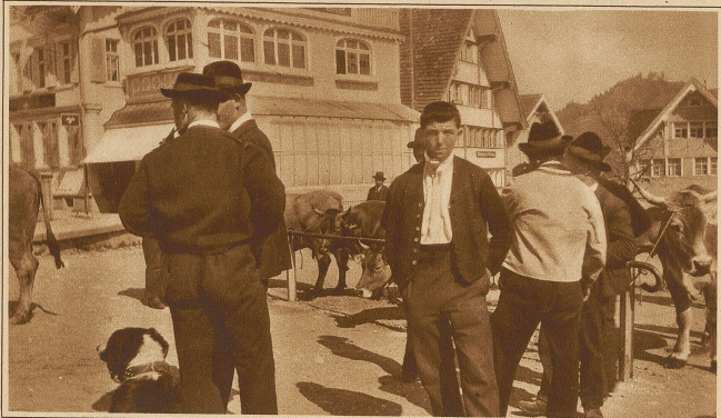
Bauertypen auf dem Viehmarkt in Appenzell