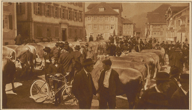
Teilsicht des Viehmarktes in Appenzell

Aber das Schreckgespenst der Schwiegermutter lebt überhaupt eigentlich nur noch in Witzblättern und Luetspielen. Man findet es selten in der Wirklichkeit. Ich wenigstens kenne eine große Anzahl von Schwiegermüttern, die in den Männern ihrer Töchter die treuesten Freunde und besten Berater haben. Ja, die große Gefahr besteht heute nicht in Haß, sondern in der Liebe des Schwiegersohnes, und je jugendlicher sich die Frauen halten, je frischer sie auch in vorgezeichneten Jahren bleiben, desto beliebter wird die