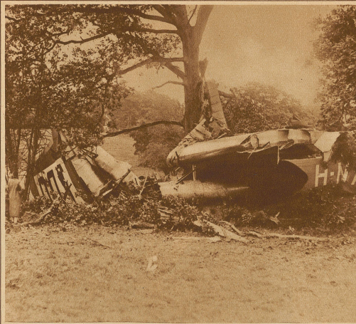
Die Trümmer eines englischen Verkehrsflugzeuges, das mit 8 Passagieren bei Sevenoaks abstürzte. Der Mechaniker wurde dabei getötet, während der Pilot und die Passagiere mit leichteren Verletzungen davorkamen