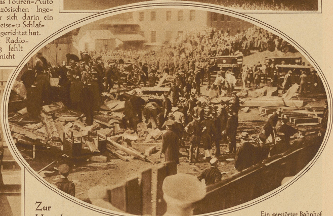
Zur Hinrichtung von Sacco und Vanzetti