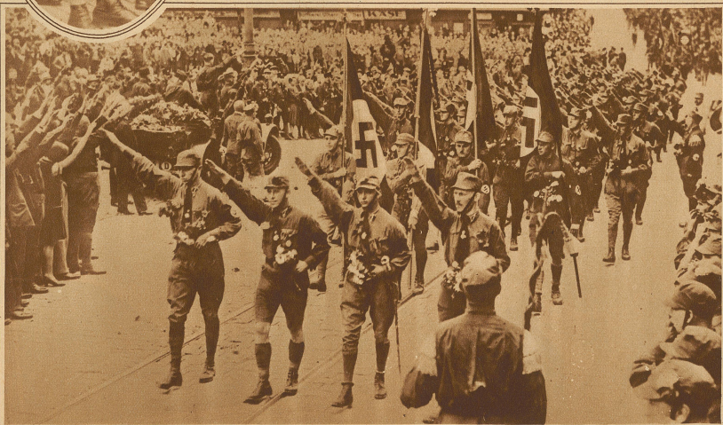
Uniformierte Nationalsozialisten durchziehen die Straßen Nürnbergs mit ihren Bannern. Der Fascistengruß scheint auch in Deutschland Schule zu machen