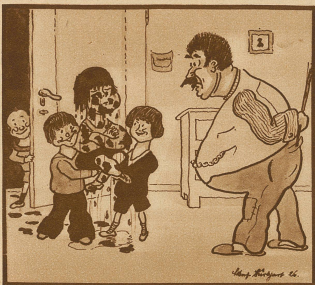
«Unverschämter Bengel, wieder in den Graben gefallen, was?» «Nee, Vater, ick bin Sieger im Straßen-Kanaldurchschwimmen!»

Lob des Bieres. Der Restaurateur B. in Königsberg empfahl das bayerische Bier in folgender Weise aus B-dur: «Brauchbare Bierbrauer-Burschen bereiten beständig bitteres, braunes, bayerisches Bier, bekanntlich besonders billiges Bedürfnis brüderlich behaglich beisamen bleibender Bürger. Betörte bierfeindliche Bacchusbrüder behaupten bisweilen bestimmt: bayerisches Bier herausehe bald, befriedige bloß Bauern, beraube besseren Bewußtseins, beschränke blühende Bildung, begründe breite Bäuche, befördere blinden Blödsinn! Begeistert Bacchus besser, — bleibt beim Besseren; besingt Burgunder, Bordeaux, Brausewein, beschimpft bosshaft bayerisches Bier. Biedere Biertrinker! Bevor Beweise Besseres bewähren, bleibt beisamt beim braunen Becherblinken, bleibt bayesische Bierfreunde beim bayerischen Bierwirt B.»