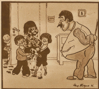
«Unverschämter Bengel, wieder in den Graben gefallen, was?» «Nee, Vater, ick bin Sieger im Straßen-Kanaldurchschwimmen!»

Lob des Bieres. Der Restaurateur B. in Königsberg empfahl das bayerische Bier in folgender Weise aus B-dur: «Brauchbare Bierbrauer-Burschen bereiten beständig bitteres, braunes, bayerisches Bier, bekanntlich besonders billiges Bedürfnis brüderlich behaglich beisamen bleibender Bürger. Betörte bierfeindliche Bacchusbrüder behaupten bisweilen bestimmt: bayerisches Bier herausehe bald, befriedige bloß Bauern, beraube besseren Bewußtseins, beschränke blühende Bildung, begründe breite Bäuche, befördere blinden Blödsinn! Begeistert Bacchus besser, — bleibt beim Besseren; besingt Burgunder, Bordeaux, Brausewein, beschimpft bosshaft bayerisches Bier. Biedere Biertrinker! Bevor Beweise Besseres bewähren, bleibt beisamt beim braunen Becherblinken, bleibt bayesische Bierfreunde beim bayerischen Bierwirt B.»