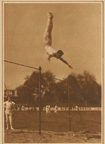
Giudici, Locarno, Fleurier am Reck