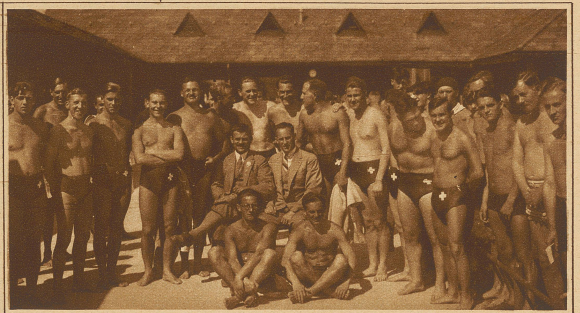
Die schweiz. Nationalmannschaft