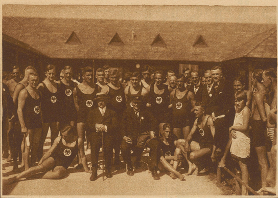
Deutschlands siegreiche Mannschaft