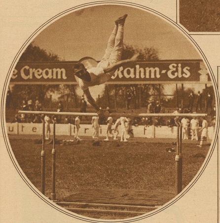
Wilhelm, Bern. Kreisflanke über beide Holme