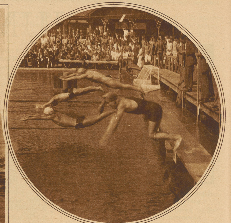
Start zum 400 m-Schwimmen freier Stil Schwimm-Länderwettkampf Deutschland-Schweiz