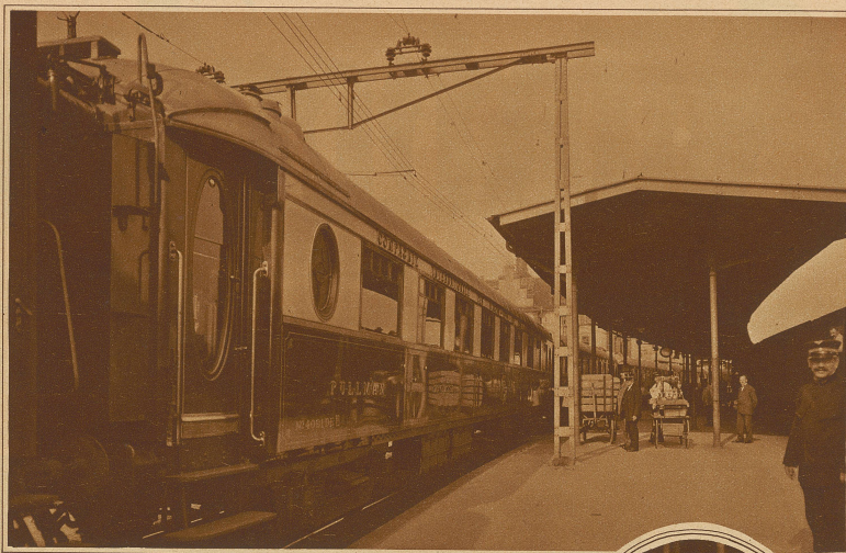
Der Gotthard-Pullman-Express bei seiner Ausfahrt aus der Station Arth-Goldau, wo die beiden Züge von Basel und Zürich zusammengelegt wurden

Der erste Pullman-Zug der Schweiz. Seit Donnerstag verkehrt auf den Strecken Basel-Zürich-Mailand und zurück ein neuer Luxuszug, der nur aus Pullman-Wagen 1. und 2. Wagenklasse zusammengesetzt ist. Die Fahrzeit beträgt, einschließlich der Anjenhalte für die 372 km lange Strecke Basel-Mailand, nur 6 Std. 40 Min. Dem Reisenden ist also neben allem Komfort auch eine außerordentl. rasche Verbindung zwischen den großen Zentren geboten