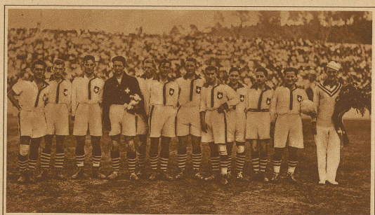
Die schweizerische Universitäts-Fußballmannschaft an den internationalen Studentenmeisterschaften in Rom