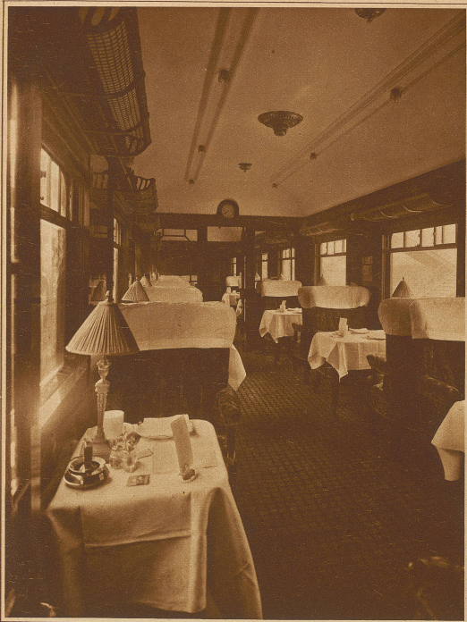
Pullman-Wagen I. Klasse, zum Frühstück gedeckt