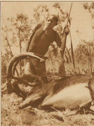
Die stolze Rappenantilope, ein Bulle

durch Wasser u. über trockenen Boden — ich habe ihn bis abends fünf Uhr noch zweimal gesehen und noch einmal auf ihn geschossen, und habe ihn nicht bekommen. Als ich mich zur Umkehr entschied, stand er wie ein vorsintflutliches Ungetüm weit draußen in einer Sumpflache, ruhig äsend, mit dem mächtigen Grind am Boden. Das sah ich selbstverständlich nur durch das Fernglas, denn sonst hätte ich noch einen Schuß wagen können. — In den Jagdbüchern kehrt der Jäger immer mit Beute heim; ich habe hier zur Abwechslung mal die Regel erzählt. — Ein andermal stieß ich frühmorgens auf die Fährte eines Elandbullen. Ich habe sie gemessen: der vordere Tritt war 11 Zentimeter,