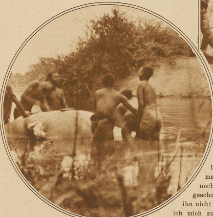
Die Eingeborenen sind erpicht auf das fetthaltige Fleisch des Nilpferdes

Wir kamen an einen mit Gras und Gesträuch umsäumten Bach, wo wir die Fährte eines Büffels im feuchten Grunde eingedrückt fanden und folgten ihr. Der Breite des Trittes nach zu urteilen, mußte es ein großer Einzelgänger sein, der hier durchgewechselt war. Auch die Schrittlänge ließ den gleichen Schluß zu. Nach einer halben Stunde sehr leisen Marsches ertönte zehn Schritte vor mir ein heftiges, kurzes Prusten und ein schwarzer Schatten sauste durch das Holz fort. Mein Schuß zerstückte sich an einem Baumstamm! Nach zwei Stunden intensiver Fährtenfolge bekam ich den Büffel wiederum zu Gesicht. Im Moment, wo ich ihn erblickte, hatte er mich auch schon weg