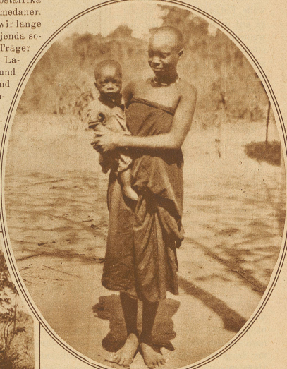
Kafferschönheit mit ihrem Kinde

gewisse Speise eine Krankheit verursachte, die dann gemieden wurde; sei es, daß man einer andern eine Heilkraft zuschrieb, die infolgedessen an bevorzugte Stelle trat. Gegenwärtig werden diese Gesetze als alte Gewohnheit befolgt, ohne daß man sich über den Ursprung und den Sinn derselben Rechenschaft gibt. Wir zogen flussabwärts und schossen verschiedene für diese Regionen typische Wildar-