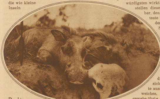
Das bizarre Warzenschwein ist in den Wäldern von Mozambique gemein

flüchtig und nur die hinterlassenen Fährten zeigten an, daß hier Wild gestanden hatte. Aber gerade das war der Reiz dieser großartigen Waldjagd; in diesem leisen, geheimen Pütschen lag etwas mystisches, etwas unberechenbares.