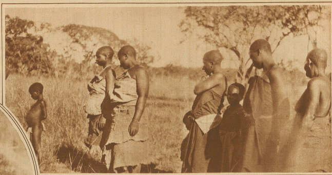
Kleider aus Rindenstoff

mitten im großen Walde liegen, und waren erstaunt über die primitive Lebensweise ihrer Bewohner. Sie hatten weder Rinder, noch Schafe und Ziegen, und kannten weder die Milch, noch deren Produkte. Es kommt eben dort die Tsetsefliege vor, welche die Haustiere nicht aufkommen läßt. Gepflanzt werden Hirse und Mais, Maniok und Bataten, und in der Nähe der strohgedeckten Hütten auch Bohnen, Erbsen und Lupinen. Wir haben aber gesehen, daß die Bewohner mit fischreusenähnlichem Flechtwerke Ratten fangen und sie verzehren, daß sie zu gleichem Zwecke