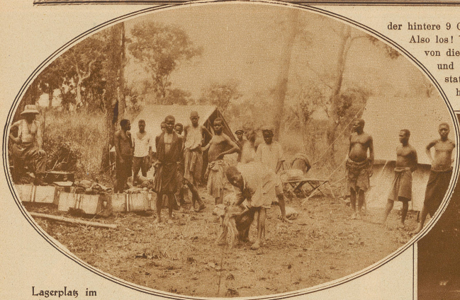
Lagerplatz im afrikanischen Buschwald

Die Stunden verflohen jeweils wie Minuten; jeder Augenblick konnte etwas Ueberraschendes bringen, kurzum, man war in fortwährender Spannung. Auf der Steppe ist die Jagd ein Kinderspiel; man erblickt das Wild auf meilenweite Entfernung und schießt es auf große Distanz mit den weittragenden Büchsen. Ich möchte sagen, daß dagegen solche Waldjagden für Feinschmecker des Waidwerkes sind, denen es nicht darauf ankommt, daß sie etwas erlegen, sondern wie sie es tun.