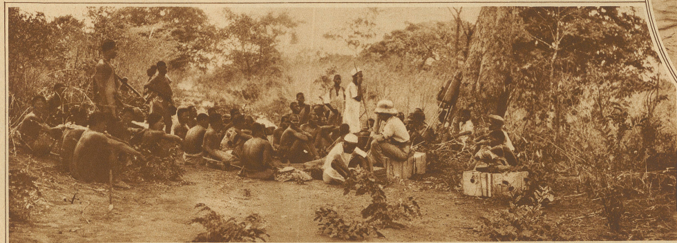
Rast unserer Expedition auf dem Marsche

Die Jagd verlangte aber viel Mühe und Arbeit und war gar nicht zu vergleichen mit den Steppenjagden in den nördlichen Gegenden. Wald und Busch, und Busch und Wald in ewiger Abwechslung, das war die Landschaft. Und da drin stund das Wild im dichten Gestrüpp, und wenn es den Jäger merkte, dann wurde es