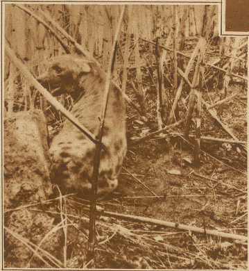
Die Hyäne sitzt in der Falle

Eines Tages zog ich mit einigen Leuten vom Lager weg in den tiefen Wald hinein. Nach Verlauf von einer Viertelstunde waren wir vom Tau tropfnaß, was mir unangenehmer war, als den nackten Eingeborenen, denen die Sonne den nassen Balg wieder trocknete, während mir die Kleider am Leibe klebten. In solchen Momenten kommt es einem so recht zum Bewußtsein, daß die Kultur den weißen Mann zu einem sehr komplizierten Individuum gemacht hat, das mit seinen Ansprüchen nach trockener Kleidung, nach gutem Geschmack, nach gutem Schuhwerk, nach gutem Essen usw. gegenüber dem Eingeborenen in großem Nachteil ist. Ohne die Bedienung und Unterstützung von Seite der anspruchlosen Schwarzen wäre der Weiße in Afrika eine Unmöglichkeit.