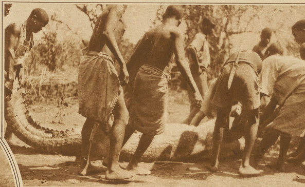
Ein mächtiges, am Lujendafluß erlegtes Krokodil

Die Schritte des verfolgten Tieres wurden kürzer; es mußte hier äsend durchgezogen sein. Noch einmal hatte es sich niedergelassen. Das mußte so sein; denn ein Wiederkäuer kann nicht stundenlang fortziehen, ohne zu rasten. Er muß zu gelegener Zeit der Arbeit des Wie-