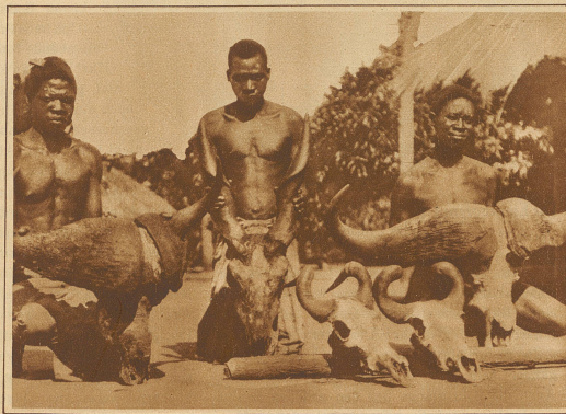
Zwei Büffelschädel, ein Schädel der Elandantilope und zwei Schädel von Lichtensteins Hartbeest

Im gleichen Flusse schossen wir ein Nilpferd; die Leute hatten Bedürfnis nach fetthaltigem Fleisch und so war in kurzer Zeit die Beute zerlegt und den Weg alles Fleisches gegangen. Doch aßen nicht alle Träger davon. Sie gehörten verschiedenen Stämmen an und jeder derselben befolgte eigene Speisegesetze. Die einen genossen nur das Fleisch gewisser Antilopenarten und verschmähten das Wildpret der Hasen; andere hielten es umgekehrt, und wieder andere aßen keine Wassertiere, weder Fische, noch Nilpferd; die Mohammedaner kein Fleisch des häufig vorkommenden Warzenschweines. Sie hätten eher Hunger gelitten, als die Vorschriften mißachtet. Solche Satzungen hatten ursprünglich einen Sinn, sei es, daß eine