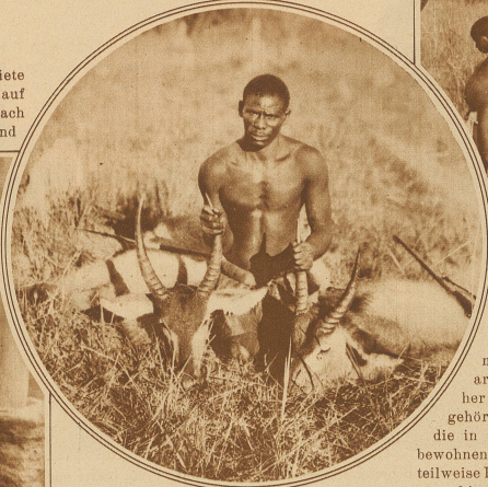
Zwei junge männliche Wasserböcke

mitten im großen Walde liegen, und waren erstaunt über die primitive Lebensweise ihrer Bewohner. Sie hatten weder Rinder, noch Schafe und Ziegen, und kannten weder die Milch, noch deren Produkte. Es kommt eben dort die Tsetsefliege vor, welche die Haustiere nicht aufkommen läßt. Gepflanzt werden Hirse und Mais, Maniok und Bataten, und in der Nähe der strohgedeckten Hütten auch Bohnen, Erbsen und Lupinen. Wir haben aber gesehen, daß die Bewohner mit fischreusenähnlichem Flechtwerke Ratten fangen und sie verzehren, daß sie zu gleichem Zwecke