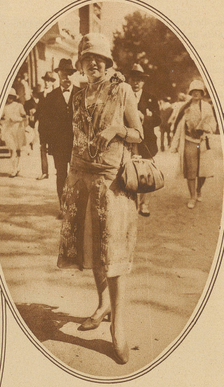
Modebilder aus Deauville