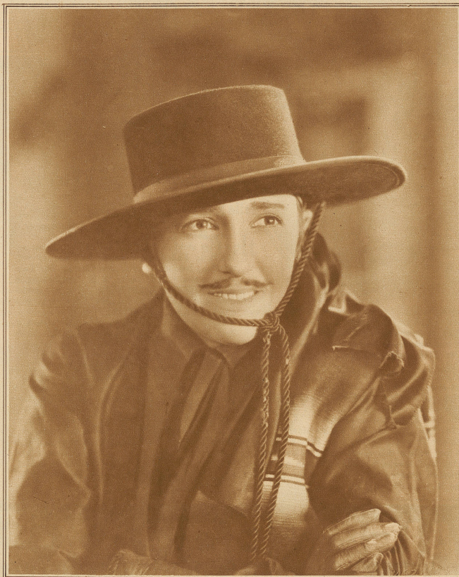
Bebe Daniels in ihrer männlichen Rolle im Film «Senorita»

Der See dehnte und streckte sich in der warmen Sonne und schluckte in der Nordbucht die letzten Eiskrusten ein.