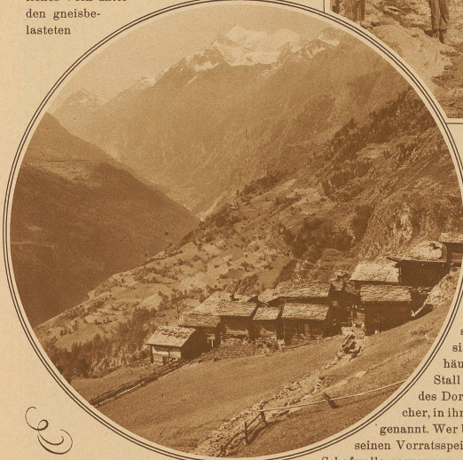
Dorfpforte mit Blick auf die Weißhorngruppe

Benützung des Wassers geschieht nicht nach dem Stand der Uhr, sondern nach dem Stand der Sonne, beziehungsweise des Schattens. Man hört ab und zu den Satz: Die Walliser Bergbauern sind faul und bequem. Das ist ein ungerichteter Vorwurf. Wer die steilen und mühsam zu bearbeitenden Bodenflächen betrachtet, der wird das Ausruhen des Höhenbewohners leicht begreifen.