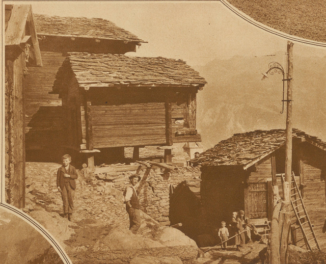
Die Speicher werden über die bekannten Gneisplatten gebaut, zum Schutze gegen Ratten und Mäuse

Ein solch einsames Bergdorf zum Ausruhen ist Törbel. Weltfern und sonndurchglüht, liegt es hoch über dem Vispertal. Von Stalden gelangt man in 2 Stunden auf gutgepflegtem Bergpfade, oder noch besser auf dem Rücken eines Maultieres nach der 600köpfigen Siedlungsinsel. Wie Besenwurf scheinen seine dunkelbraunen Häuschen in die blumigen Bergwiesen hineingeworfen. Dem Wanderer winkt da oben kein einziges Wirtshauschild entgegen, keine einzige Pinte ladet Gäste ein. Dafür wohnt ein gastfreundliches Volk unter den gneisbelasteten