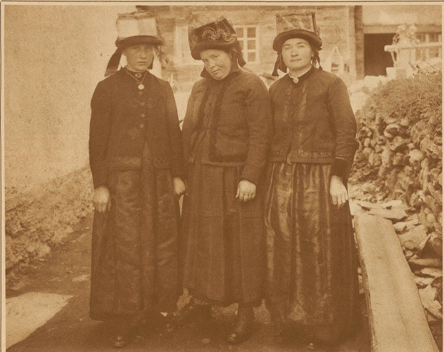
Töblierinnen im Sonntagskleid

Dörfchen Törbel, und durchglüht es, bis abends spät die feurige Kugel im Westen verschwindet. Die Einteilung der Bewässerung und die