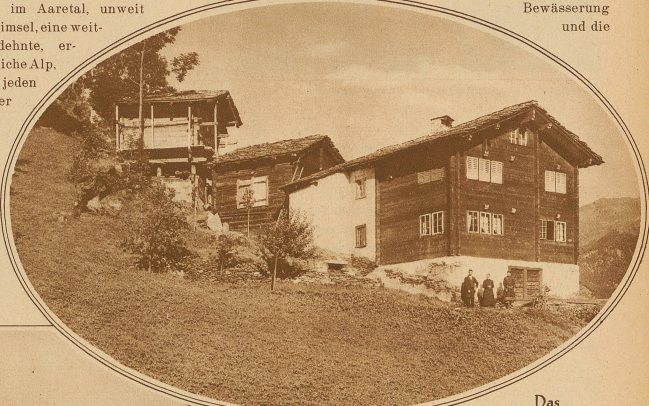
Das Törbler Heimwesen: Wohnhaus, Stall und Speicher hintereinander

Bekanntermaßen werden alle Walliser Bergdörfer von einem mühevoll angelegten Bewässerungssystem durchzogen. So auch Törbel. Leider besitzt es keine Gletscherbäche, wie z. B., das gegenüberliegende Grächen. Es gehört daher zu den trockensten Orten im Wallis. Hat der erste Sonnenstrahl im Osten das Fletschhorn vergoldet, fällt er gleich nachher aufs