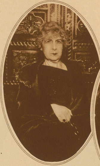
Eine 65jährige Dame vor der Operation

Ein Pariser Arzt, Dr. Bouchon, erfand eine neue Methode, um auf chirurgischem Wege Unscheinheiten im Gesicht und