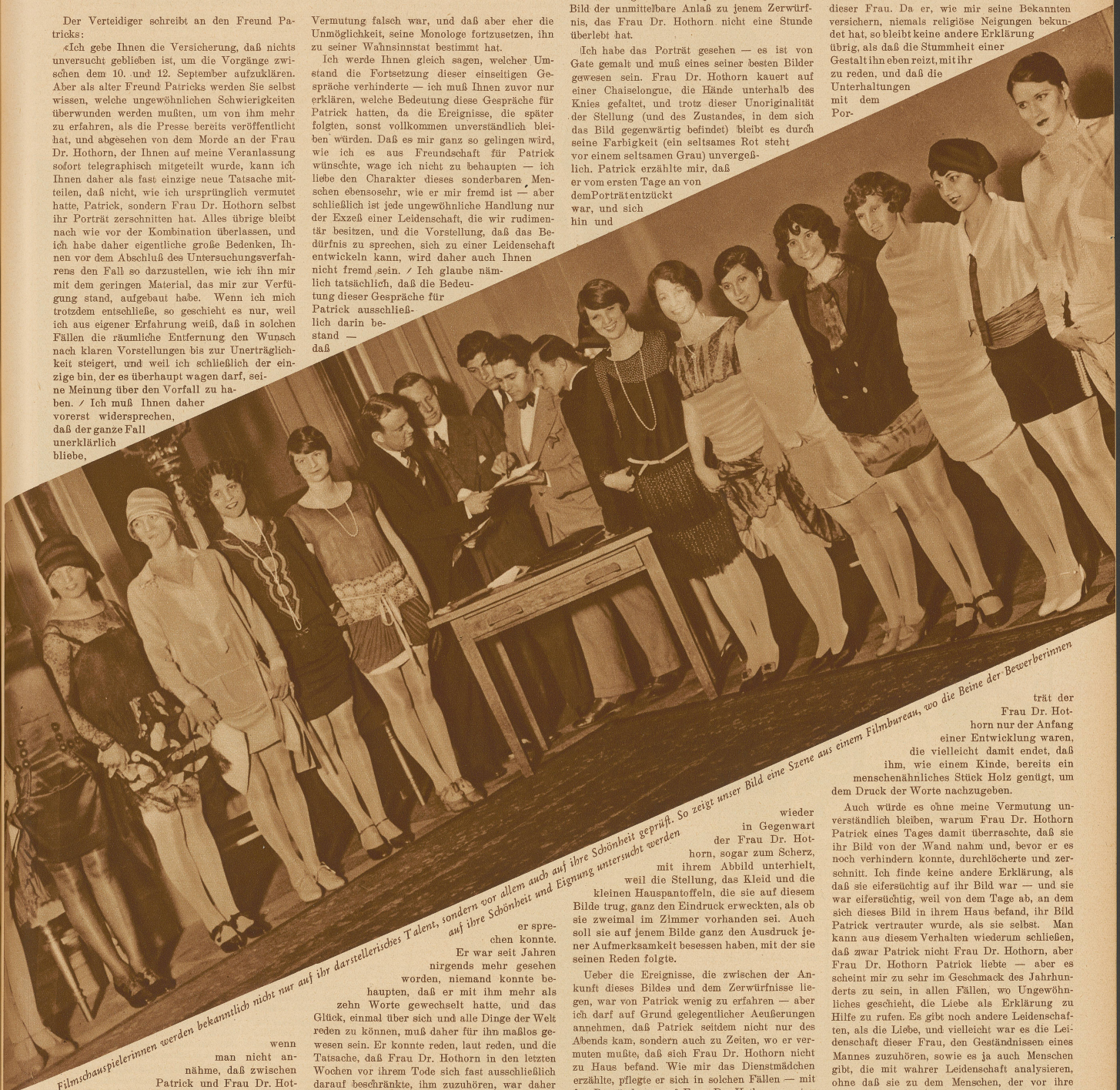
Filmschauspielerinnen werden bekanntlich nicht nur auf ihr darstellerisches Talent, sondern vor allem auch auf ihre Schönheit geprüft. So zeigt unser Bild eine Szene aus einem Filmbureau, wo die Beine der Bewerberinnen

Ich nehme es vor allem deshalb an, weil sich in der Zelle, in die man Patrick geschickt hat, eine kleine Statue der Maria befindet — und weil er sich mit dieser Statue unterhält, wie wahrscheinlich einst mit dieser Frau. Da er, wie mir seine Bekannten versichern, niemals religiöse Neigungen bekundet hat, so bleibt keine andere Erklärung übrig, als daß die Stummheit einer Gestalt ihn eben reizt, mit ihr zu reden, und daß die Unterhaltungen mit dem Por-