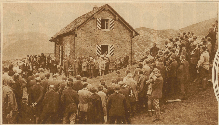
Einweihungsfeier der neuerbauten Klubhütte Glattalp der Sektion Mythen S. A. C. in den Muotathalerbergen, 3 Stunden oberhalb Bisisthal. Sie dient als Stützpunkt zur Besteigung der Märenberge, Leckistock, Jägerstöcke, Ortstock, Hohturn, Kilchberge und zu den Uebersängen nach Urnerboden u. Braunwald-Linthal