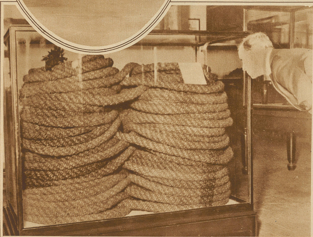
Im Bethnal Green-Museum in London wird jetzt ein aus Japan stammendes Tau gezeigt, das ein englischer Kaufmann in Yokohama vor 50 Jahren hinterließ. Es ist gänzlich aus Menschenhaar hergestellt und hat eine Länge von über 200 Meter. Die Regierung der damals Tikon genannten Insel hatte ein Tau von ungewöhnlicher Stärke angefordert, und so wurde durch 6 Jahre alles verfügbare Frauenhaar gesammelt und zur Herstellung eines Taus verwendet