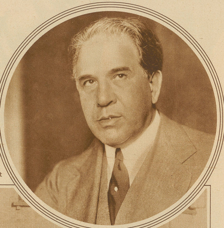
TITA RUFFO, der berühmte Sänger, gab letzte Woche in Zürich ein Konzert