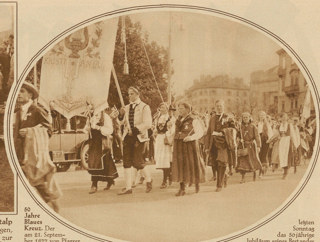
50 Jahre Blaues Kreuz. Der am 21. September 1877 von Pfarrer Roschat in Gené gegründete Verein zur Rettung von Trunksüchtigen konnte am 21. September 1927 sein 50-jähriges Bestehen feiern. Unser Bild zeigt einen Teil des Festzuges mit der norwegischen Delegation