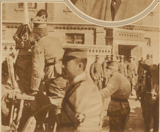
Noch immer ein alltägliches Schauspiel sind in China Hinrichtungen auf offener Straße. Das Bild zeigt die Hinrichtung eines Deserteurs in Pukau