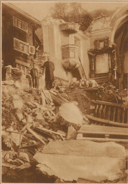
Bild links: Im Innenraum der zerstörten Kirche, von welcher neben dem Turm einzig die Kanzel stehen ge- blieben ist

Bild rechts: Das 4-5 m hohe Schuttfeld, das den größten Teil des urbanen Bodens des Dörf- chens Ringgenberg zudeckt hat. Die Rufe legte drei Wohnhäuser, mehrere Ställe und die Kirche in Trümmer