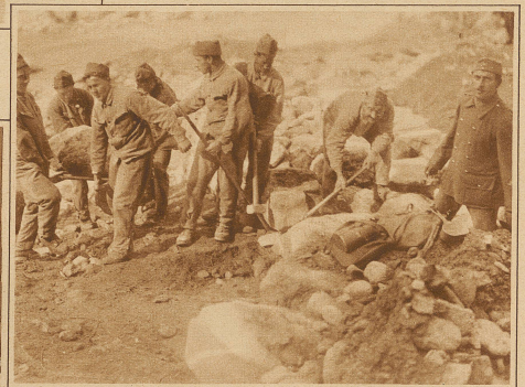
Bild links: Sprengung des Rheinlammes bei Benclem. Leider blieb dieser Versuch, den Rhein ins alte Bett zurückzuleiten, ohne Erfolg

Sappeure bei den Aufräumarbeiten und auf der Suche nach den Toten