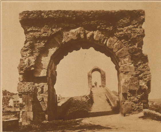
Vorderansicht der Puente del diablo über den Rio Llobregat