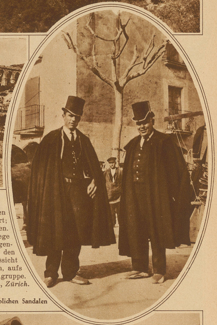
Bild rechts: Polizisten aus Catalonien mit ihren landestüblichen Sandalen