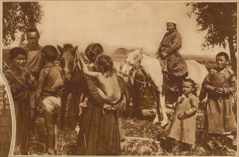
Eine vielföpfige Sojotenfamilie

Tanu-Tuva, das früher Uriankhaisk hieß und eine chinesische Provinz war, kam im Jahre 1911, nach der Erklärung der mongolischen Autonomie, unter russische Herrschaft, ist aber jetzt ein selbständiges Staatswesen. Es ist ein gebirgiges Land, dessen Täler von teilweise sehr großen Flüssen bewässert werden. Hier