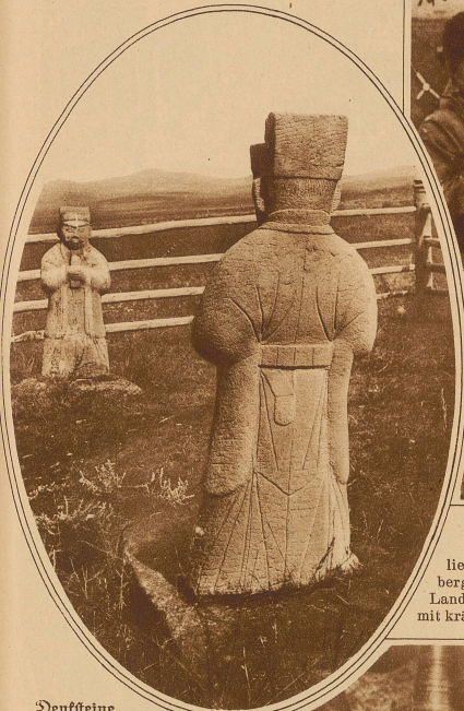
Denksteine aus vorchristlicher Zeit in der Urjanchai-Steppe

Im Inneren Asiens, zwischen der Mongolei und dem russischen Distrikt Minusinsk liegt die kleine Republik Tanu-Tuva. Als die Sowjetregierung gegen Ende des Jahres 1926 eine anthropologische Expedition in dieses Ländchen entsandte, waren ihre Teilnehmer die ersten Europäer, die es jemals betreten haben.