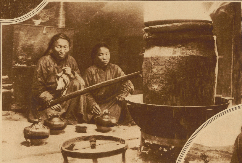
Bauernpaar beim Bereiten der «Surt», eines Kaufgetränkes aus Pflanzenstäben und saurer Milch

Die Bevölkerung von Tanu-Tuva zählt heute ungefähr 80000 Seelen, wovon 70000 auf Eingeborene entfallen, 10000 auf russische Kolonisten. Die letzteren sind es hauptsächlich, die sich dem Rentierfang widmen; das Rentier ist ja das Haustier der Mongolen, die aus seinem Geweih ein Medikament gegen allerlei Krankheiten bereiten, mit dem ein schwunghafter Handel betrieben wird. Die Lebensweise dieser Tiere macht die Tuvinen zu Nomaden. Ist nämlich eine Weide abgegrast, so ziehen die Herden weiter und die Menschen sind gezwungen, den Tieren, ihrem lebenden Vermögen, zu folgen, wollen sie es nicht verlieren. / Die Religion der Tuvinen ist der Lamaismus, doch haben sich in ihren Kult so viele mongolische und andere Gebräuche eingeschlichen, daß man fast sagen kann, sie hätten ihren eigenen Glauben. Die Tuvinen sind der friedlichste Menschenschlag, den man sich denken kann. Pfeil und Bogen (Schußwaffen