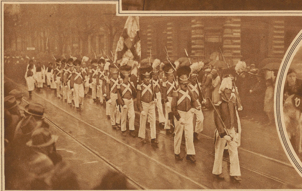
Grenadiere aus dem Lötschental