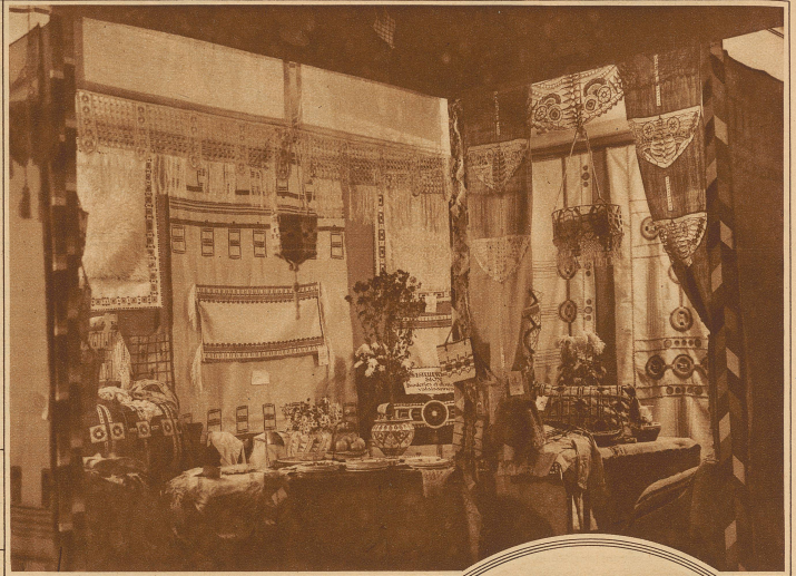
Die Obstausstellung Walliser Woche in Zürich Bild rechts: Kunstgewerbe