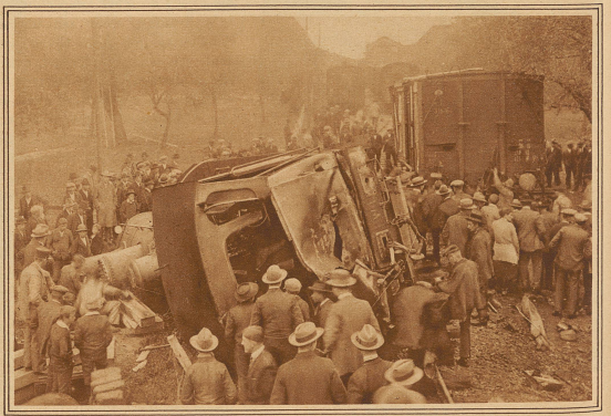
Auf der Langenthal-Hüttwil-Bahn ereignete sich letzten Samstag ein Eisenbahnunglück, das schwere Folgen hätte haben können. Infolge eines Schienenbruches entgleiste bei der Ausfahrt aus der Station Madiswil ein Güterzug. Die Lokomotive und die drei folgenden Wagen wurden umgeworfen. Wie durch ein Wunder blieben Führer und Heizer unverletzt und konnten aus der stark beschädigten Lokomotive hinauskriechen