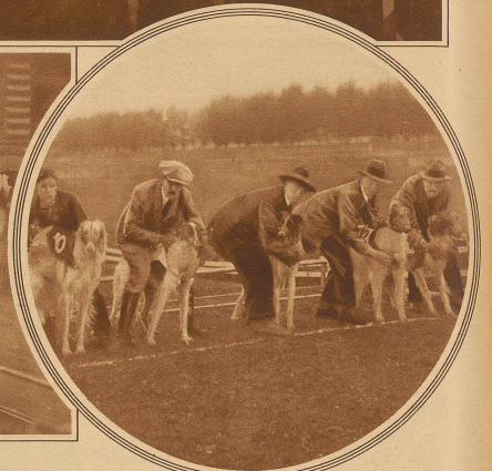
Flachrennen für Barsois. Am Start