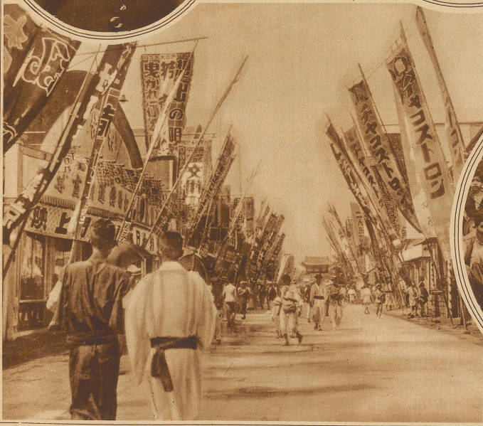
Japans Straßen des Vergnügens. Eine Straße von Tokio, an welcher sich beinahe nur Kinos und Teehäuser befinden, die mit ihren originellen Reklameschildern zum Besuche einladen