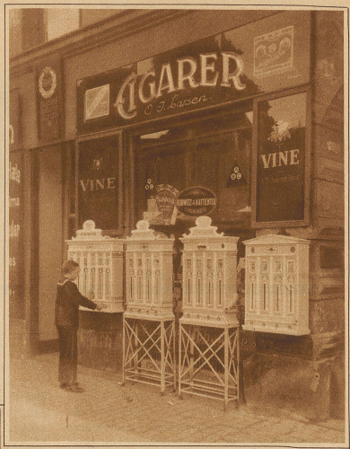
Bild rechts: Der Automat als Verkäufer nach Ladenschluß. In Kopenhagen kommt kein Raucher mehr in Verlegenheit. Die meisten Zigarrenhändler haben sich nämlich eine ganze Anzahl Automaten angeschafft, die während der ganzen Nacht u. den Sonntag über die hauptsächlichsten Sorten Zigarren und Zigaretten abgeben