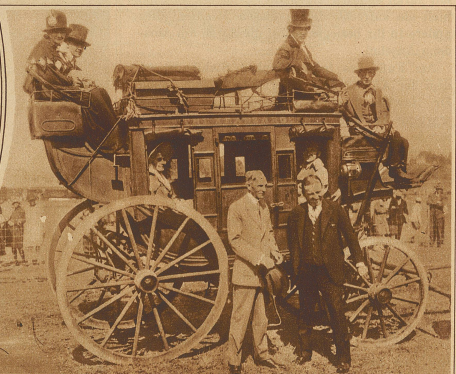
Bevor das Auto erfunden wurde, besaß auch der Automobilkönig Henry Ford eine Reisekutsche, die er jetzt als Antiquität auf der Eisenbahn-Ausstellung in Baltimore ausgestellt hat. Henry Ford steht vor dem Reisewagen, der unsern alten Alpenposten nicht unähnlich sieht