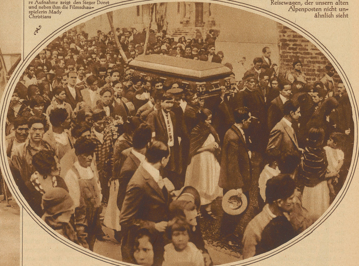
Zu den Unruhen in Mexiko. Das Begräbnis der Generals Serrano, der schon am zweiten Tage des Aufstandes hingerichtet und zur Abschreckung öffentlich zur Schau gestellt wurde