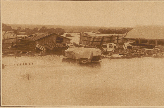
Eine schwere Unwetterkatastrophe hat das Gebiet von Vladivostok im fernen Osten heimgesucht. Die Gewalt des Sturmes war so groß, daß er das Wasser meilenweit ins Land hinein getrieben hat, ganze Dörfer wegschwemmte und Eisenbahnzüge umriß. Das Bild zeigt die Überschwemmungen in der Nähe der Stadt Iman