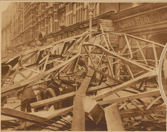
Zerstörungen in Southampton, wo der Kran eines Neubaus umstürzte und auf ein in diesem Moment vorbeifahrendes Auto fiel, wobei zwei Insassen getötet wurden