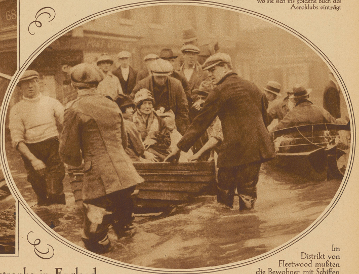
Im Distrikt von Fleetwood mußten die Bewohner mit Schiffen aus den Häusern geholt werden