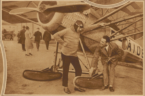
Chevreau, ein französischer Ingenieur, hat auf dem Gebiete des Flugzeugbaus eine bemerkenswerte neue Erfindung gemacht. Er ersetzt die Räder durch Ketten in ähnlicher Form, wie sie die Raupenautomobile tragen. Auf diese Weise soll es möglich sein, die Anlaufhöhe beim Start und vor allem die Landungsfläche auf ein Minimum zu reduzieren