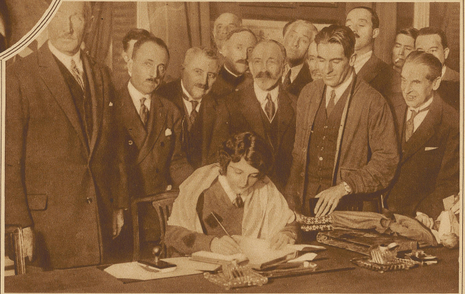
Mit Ruth Elder, die verwegene Ozeanfliegerin, die in der Nähe der Azoren von einem holländischen Dampfer aufgefischt wurde, ist in Paris eingetroffen und wird dort entsprechend gefeiert. Unsere Aufnahme zeigt sie im Moment, wo sie sich ins goldene Buch des Aeroklubs einträgt