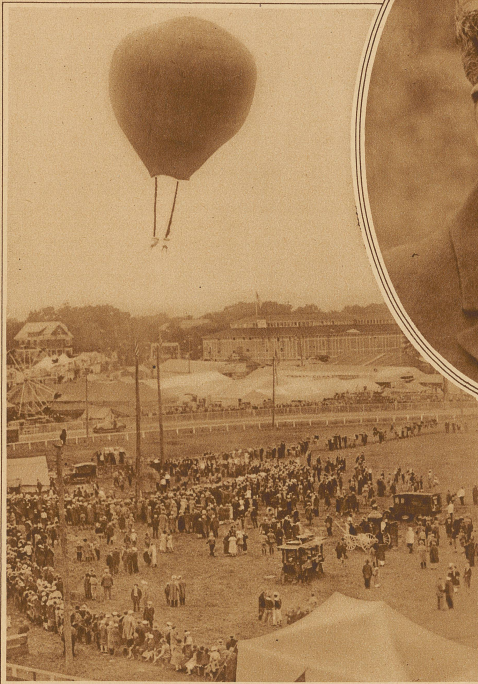
Eigenartige Rekorde. In Brockton (Amerika) stiegen zwei Akrobaten mit einem Ballon bis zu 1000 m Höhe auf, durchschnitten dann die Seile und ließen sich mit dem Fallschirm zur Erde nieder