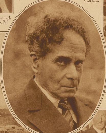
Maximilian Harden, der im kaiserlichen Deutschland gefürchtete Herausgeber der „Zukunft“, ist im Alter von 66 Jahren in Montana gestorben