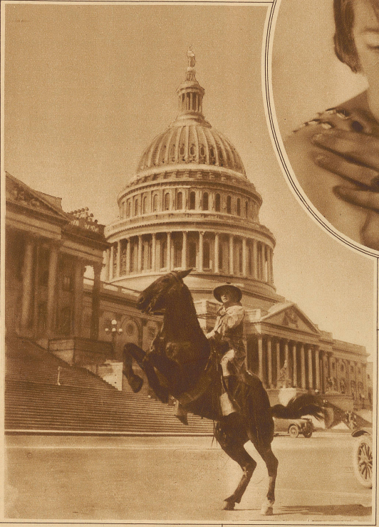
Eine mutige Amazone ist die bekannte amerikanische Schönheit Miß Vonciel Viking, die auf Grund einer Wette für 25000 Dollar einen Distanzritt von New York nach Los Angeles ausführt. Das Bild zeigt Miß Viking vor dem Capitol in Washington