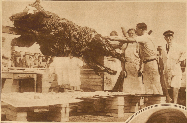
Einer der interessantesten ungarischen Volksbräuche ist das aus der Heidenzeit stammende öffentliche Braten eines ganzen Ochsens. Während aber früher der Ochs von irgendeinem reichen Stiften zur Verfügung gestellt, und die Bratenstücke verschenkt wurden, haben sich heute die Metzger der Sache bemächtigt und verkaufen die Bissen um gutes Geld