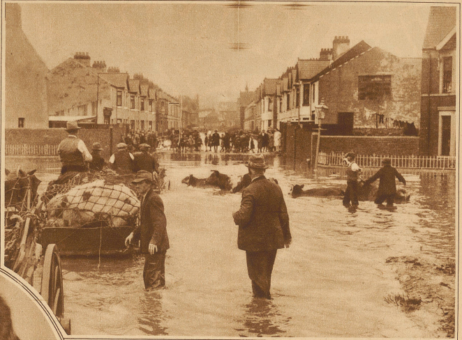
Das Hochwasser, das vorige Woche England heimsuchte, hat auch in Wales große Verheerungen angerichtet, wo ganze Dörfer unter Wasser gesetzt wurden. Das Bild zeigt eine Szene aus Cardiff