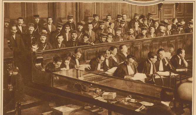
Vor dem Pariser Schwurgericht hat letzte Woche ein Monsterprozeß gegen eine polnische Banditenbande von 19 Köpfen begonnen. Nicht weniger als 6 Morde, 4 Totschlagsversuche und 68 Einbrüche werden ihr zur Last gelegt. Die Aufnahme zeigt einen Blick auf die Angeklagtenbank