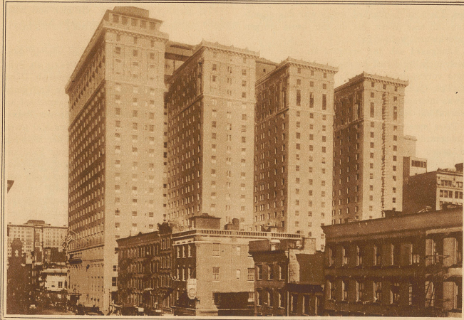
Das größte Hotel der Welt, das Hotel Pennsylvania in New York, ist eröffnet worden. Die 2200 Zimmer weisen allen erdenklichen Komfort auf