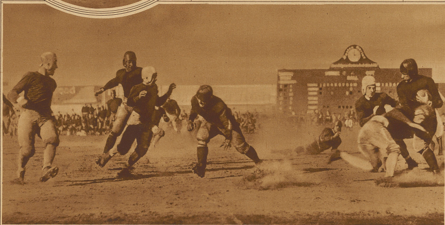
Kampfszene aus einem Baseballspiel zwischen zwei amerikanischen Universitäten