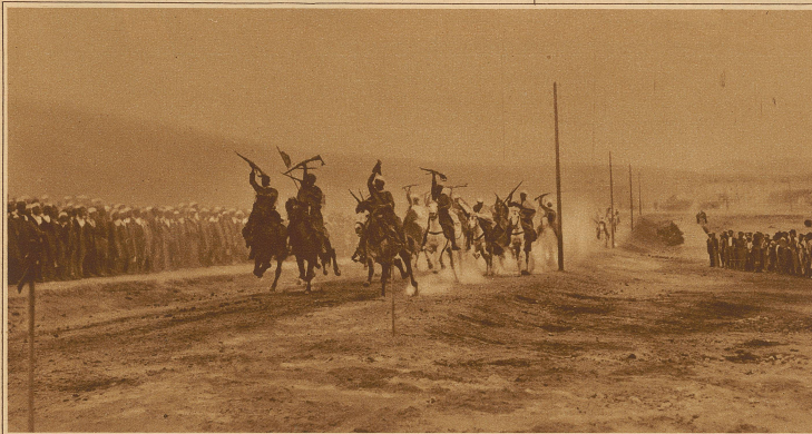
Reiterspiele marokkanischer Kavallerie