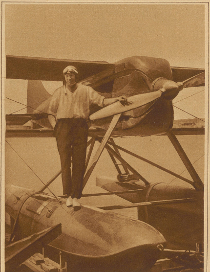
Der amerikanische Marineleutnant Williams hat letzte Woche mit seinem Wasserflugzeug eine Stundengeschwindigkeit von 517 km erreicht und mit dieser phänomenalen Leistung alle bestehenden Geschwindigkeitsrekorde geschlagen