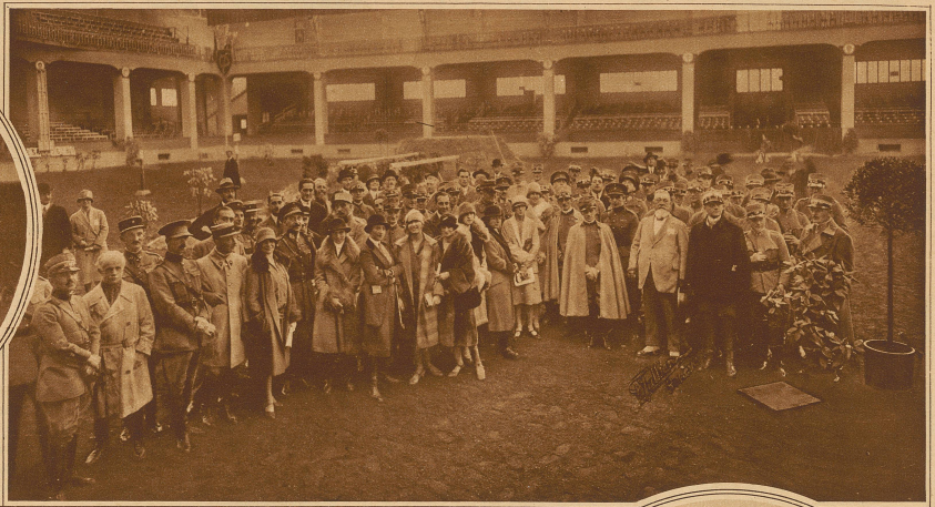
Gruppe der Teilnehmer am Concours Hippique in Gent