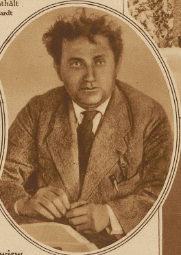
Troski und Sinowjew die beiden Führer der Opposition, die auf Antrag Moskaus aus der kommunistischen Partei ausgeschlossen wurden