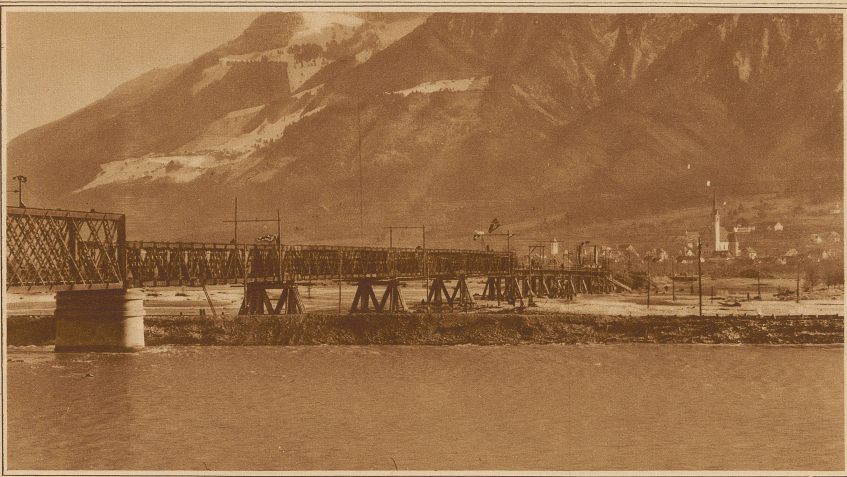
Am Donnerstag ist nun der Verkehr über die fertiggestellte provisorische Eisenbahnbrücke Buchs-Schaan wieder aufgenommen worden, nachdem vorher eine Belastungsprobe mit zwei schweizerischen Dampflokomotiven von 108 bzw. 198 Tonnen Dienstgewicht durchgeführt worden war. Das Bild zeigt die auf Holpfählern ruhende provisorische Brücke