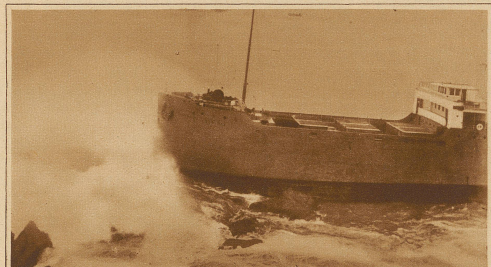
Die letzten Stürme im Pacific haben wieder zahlreiche Opfer gefordert. So wurden u. a. zwei Schiffe auf die Felsenriffe von Lands End bei San Francisco geworfen. Unser Bild zeigt im Vordergrund ein festgefahrenes Transportschiff und im Hintergrund einen gestrandeten Segler, dem durch ein Dampfschiff Hilfe geleistet wurde