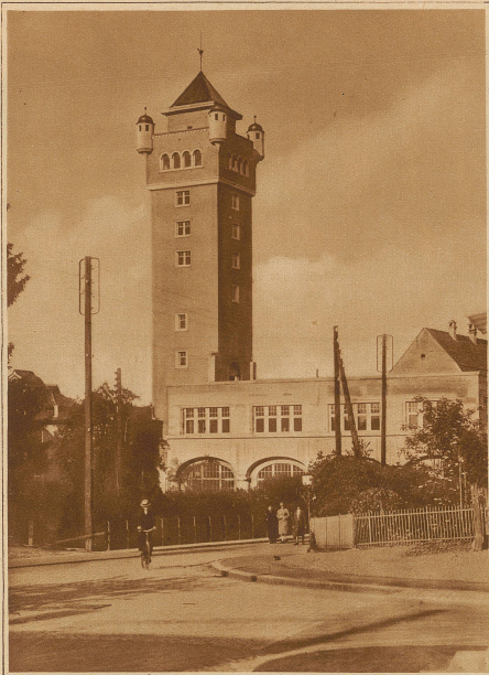
Ein originelles Fabrikamin, das inmitten des Städtchens Arbon errichtet wurde und eine Wohnung, eine Aussichtsterrasse, ein Hochdruck-Wasserreservoir und einen Lift enthält