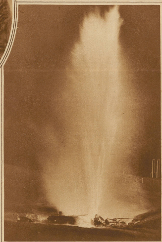
Die Riesenerschütterung des Gaswerkes von Pittsburgh in Pennsylvania. Etwa 50 Personen wurden getötet und über 600 verletzt. In einer Distanz von 2 1/2 km fand man Stücke der Gasometer im Gewicht von 50 kg. Hunderte von Häusern liegen in Trümmern