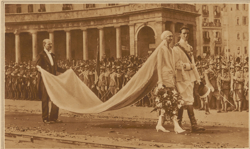
Aus der pompösen Hochzeitsfeier des Herzogs Amadeus von Apulien, eines Vettres des Königs von Italien, mit der Prinzessin Anna von Orleans. Das Brautpaar verläßt die Kirche in Neapel