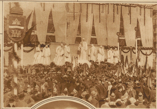
Am 6. November wurde vor dem Parlamentsgebäude in Budapest unter großer Be- teiligung der Bevölkerung ein Denkmal für Ludwig Kossuth, den großen un- garischen Staatsmann u. Freiheitshelden, ent- hüllt. Das Bild zeigt die Enthüllungsfest