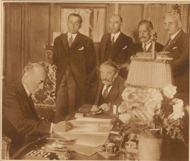
Unterzeichnung des französisch-jugoslawischen Freundschaftsvertrages, der offenbar als Gegenaktion zur jüngsten Flotten- demonstration der Italiener gewertet werden will und in Italien großes Aufsehen erregte. Der jugoslawische Außenminister Marinkovitch (links) unterzeichnet den Vertrag in Anwesenheit Briand's