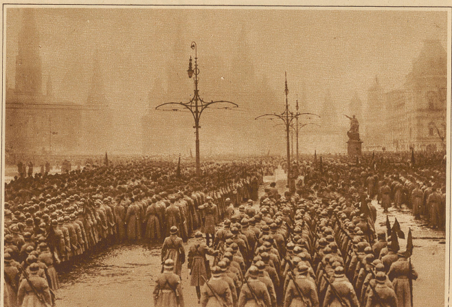
Die große Parade der Roten Armee auf dem Roten Platz in Moskau anlässlich der Feier zum 10-jährigen Jubiläum der Oktober-Revolution