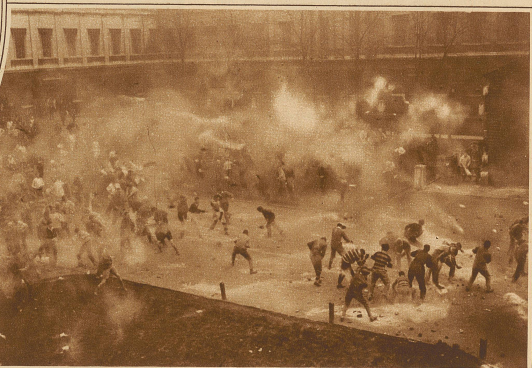
Englischer Studentenulk. Anlässlich der Rektorswahl für die Universität Aberdeen wird eine Tonne Erbsenmehl in kleinen Tüten unter die Studenten verteilt. Wie unser am 10. November aufgenommenes Bild zeigt, wird diese Munition recht wirksam zur Durchführung einer regelrechten Schlacht verwendet