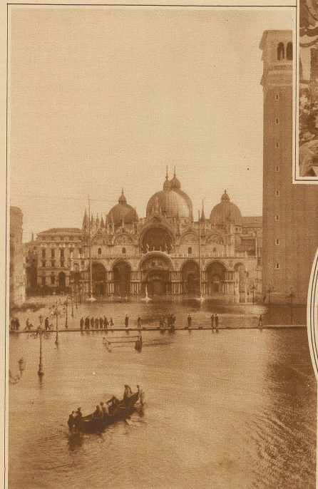
Außergewöhnlich starke Ueberschwemmung in Venedig. Der Markusplatz und die angrenzenden Stadtteile sind derart unter Wasser gesetzt, daß der Fußgängerver- kehr mittels Notbrücken aufrecht erhalten wird und die Gondeln quer über den Markusplatz fahren können