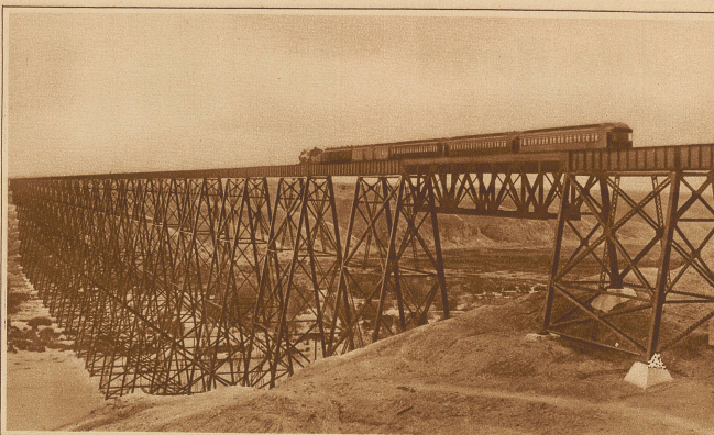
Ein Wunderwerk amerikanischer Technik. Der mehr als 100 m hohe und über 1700 m lange Lethbridge-Viadukt über den Belly-Fluß