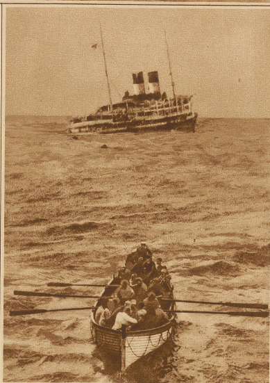
Das erste Bild vom Untergang der «Principessa Mafalda». Ein vom englischen Dampfer «Empirestar» ausgesetztes Rettungsboot mit geretteten Passagieren; im Hintergrunde die sinkende «Principessa Mafalda»