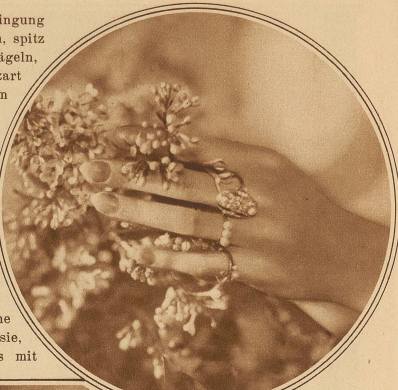
Mit Ringen überladene Hand

der feinfühligere Betrachter erkennt doch unter allem Bearbeitetsein die edle Grundform und sie erscheint ihm noch preisenswerter als die schöne Hand, die nichts zu tun hat, als sich zu pflegen.