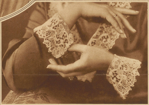
Arbeitsame und doch vornehme Hände

gingen in den Werken slawischer Dichter. / Was nennt man nun eigentlich eine schöne Frauenhand?