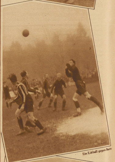
Ein Eckball gegen Bern