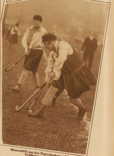
Momentbild aus dem Damenhockeyspiel Winterthur. Grasshoppers II 3 : 1