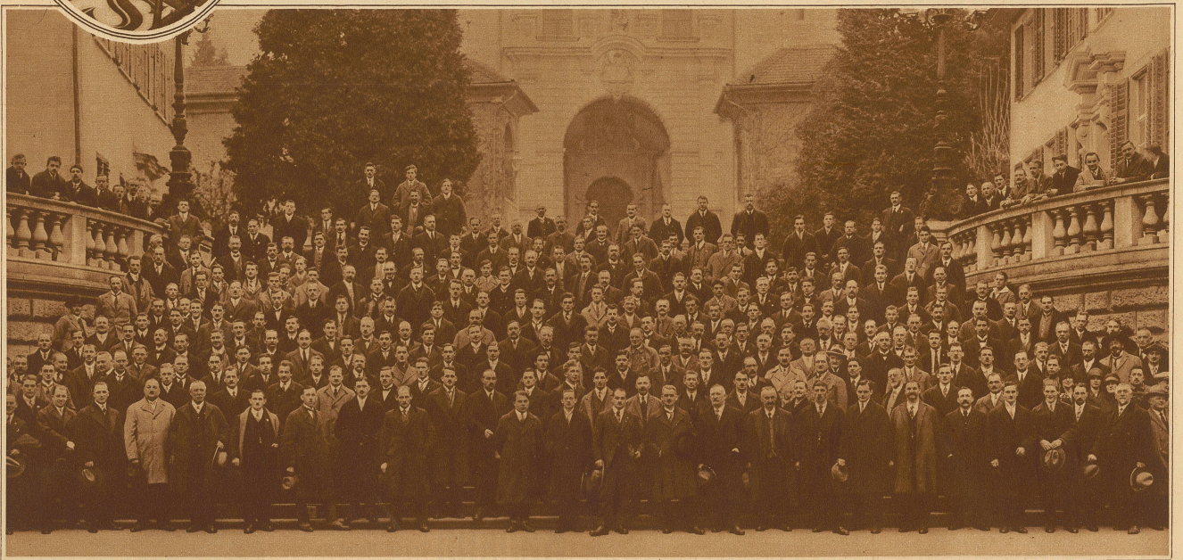
DIE DELEGIERTEN DES SCHWEIZERISCHEN RADFAHRER-BUNDES ANLÄSSLICH IHRER TAGUNG IN LUZERN