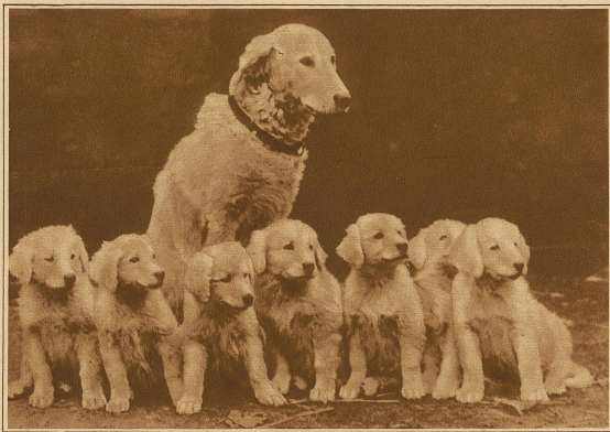
Eine kostbare Hundefamilie im Werte von 17000 Dollar wurde in Los Angeles von einem Schweizer ausgestellt