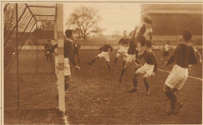
Drahhoppers - Chiasso 9:0 Ein Eckball gegen die Tessiner