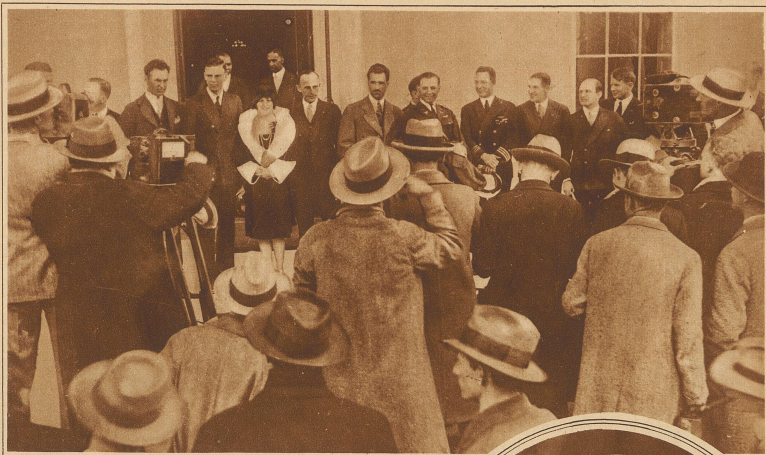
Präsident Coolidge empfing alle amerikanischen Ozeanflieger im Weißen Haus. Man bemerkt auf der Aufnahme u. a. Lindbergh, Byrd, Chamberlin, Ruth Elders und Levine