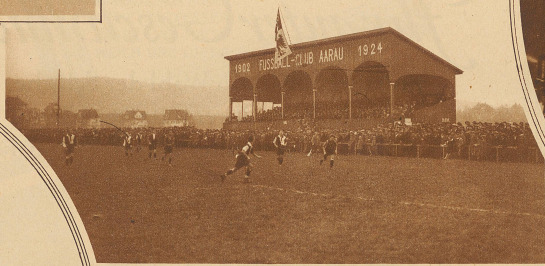
Flügelgriff der Berner