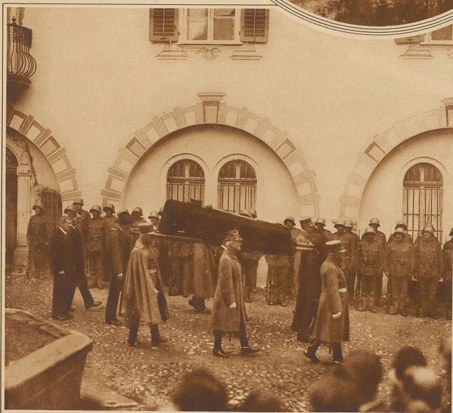
Die Korpskommandanten begleiten den Sarg ihres Kameraden zum Friedhof

Das Familiengrab der Sprecher von Bernegg