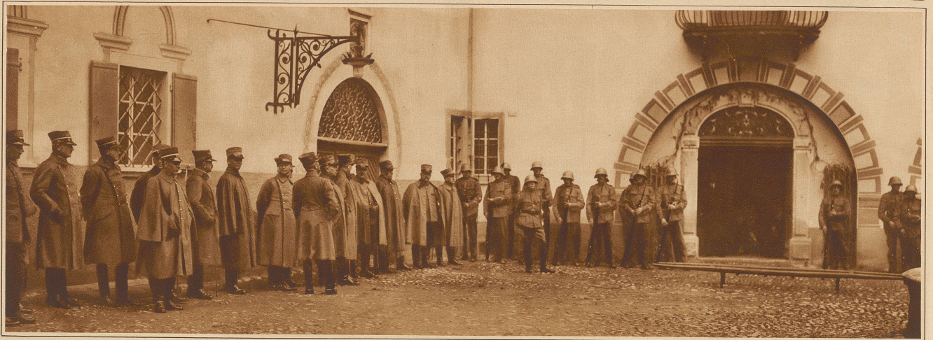
DIE EHRENWACHE AM EINGANG DES VON SPRECHERSCHEN GUTES