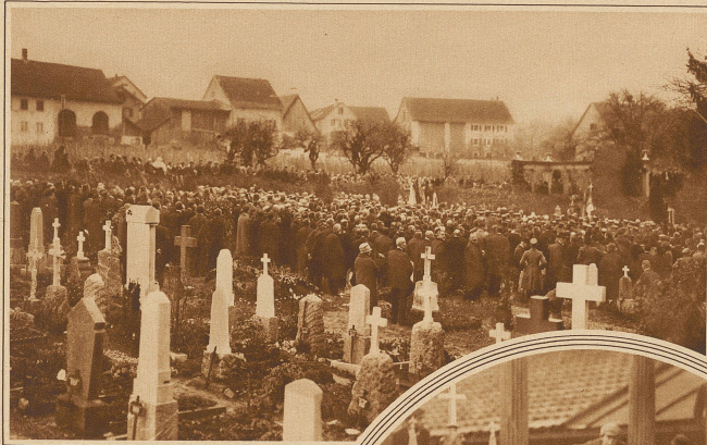
Die Abdankung auf dem Friedhof