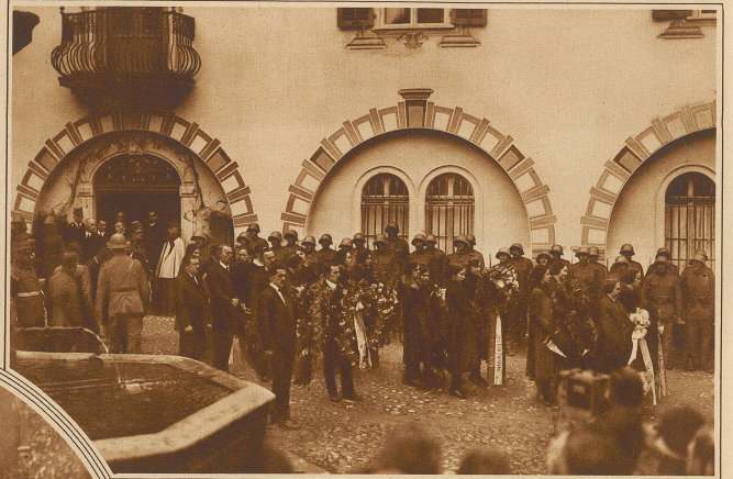
Der Leichenzug verläßt das Trauerhaus