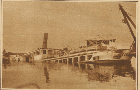
Das halbwegs gehobene Schiff Die Hebung des im Luganersee versunkenen Dampfers «Ticino»