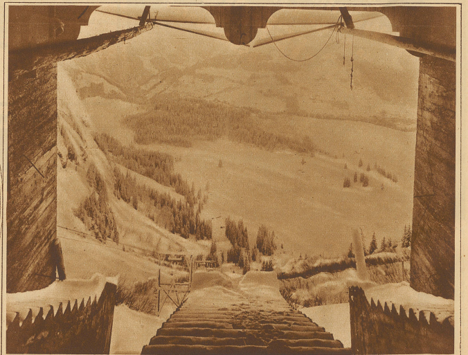
Blick von der Station Trübssee auf das Engelbergertal