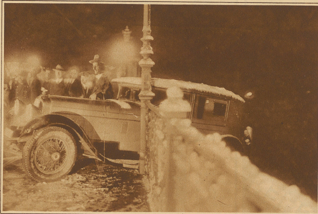
Ein eigenartiger Autounfall ereignete sich in der Nacht vom Montag auf den Dienstag auf der Weisssteinstrasse in Basel, wo ein strom Taxi vorfahrendes Auto mit dem hinteren Wagenteil gegen das guttöse Gelände gerieten wurde, dieses durchbroch und schliesslich beinahe zur Hälfte über der stühnenden Tiefe hingab. Es läst sich leicht denken, in welcher Grotteskverfassung die drei Insassen, an denen der Ted haarscharf vorübergang, aus dem Auto gedorren sind.