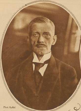
Bundesrat Haab der neue Vizepräsident des Bundesrates