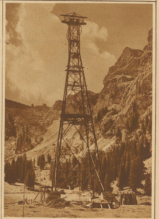
Die 63 m hohe Tragsäule 3 im Bau. Zwischen dieser und der nächsten Säule beträgt die Spannweite der Tragsäule 1045 m Die erste schweizerische Schwebbahn von Gerschnialp auf Trübssee ist am Samstag in Engelberg offiziell eingeweiht worden. Die Laufbahn hat eine Länge von 3285 m und die Steigung beträgt 551,8 m. Mit dieser Bahn erhält Engelberg einen neuen Anziehungspunkt als Kur- und Sportplatz, denn sie bietet Gelegenheit, mittels der hochalpinen Skifelder auf Trübssee zu erreichen