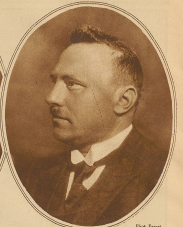
Nationalratspräsident R. Minger