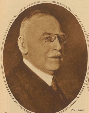
Pierre Favarger der Kandidat de Dardels im Nationalrat. Die Validierung seiner Wahl führt zu einer Ordensdebatte, da Favarger Ritter der franz. Ehrenlegion ist, und nach Bundesverfassung das Tragen eines Ordens mit der Ausübung des Nationalratsmandates nicht vereinbar ist