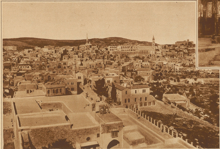
Blick auf die Stadt Bethlehem

viel näher gerückt, weil der Autoverkehr das ganze Land durchzieht. Binnen zwanzig Minuten gelang man auf einer kreidigen und staubigen Landstraße nach Bethlehem. Wie seltsam still ist es in diesen engen winkligen Gassen, wo helles Sonnenlicht schimmert und zerfallenes Mauerwerk oft noch an eine arme Zeit erinnert. Wie leicht und behend schreiten Bethlehems Töchter daher, schön und anmutig, geschmückt mit bunten Kleidern und hohem weißem Kopfputz, der für Bethlehem charakteristisch ist; wie schön sind die Frauen dieser Stadt, edel von Wuchs und Antlitz, ebenbürtig des Ortes, der wie ein kostbares Juwel in den Gezeiten der Jahrtausende eingebettet liegt.