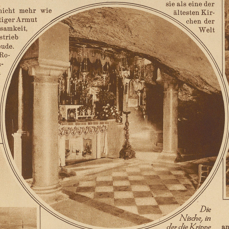
Die Nische, in der die Krippe gestanden haben soll

ches ist zwar nicht mehr wie früher. Aus einstiger Armut erwuchs Regsamkeit, Selbsterhaltungstrieb und Arbeitsfreude. Perlmutter vom Roten Meere, Pechstein vom Toten Meere, Cedernholz vom Libanon wurden den Bethlehemiten wertvoll für eine regsame In-