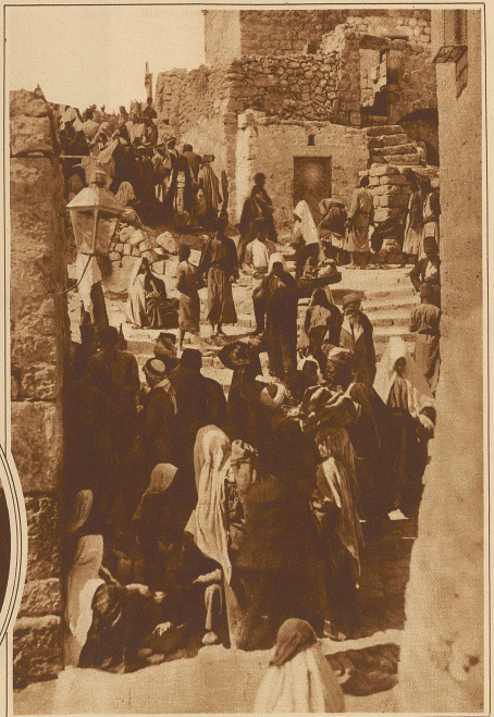
Straßenleben in Bethlehem

der verschiedenen Bekenntnisse klingt jene Melodie, die uns von Jugend auf so vertraut ist. Mohammedanische Zerstörerhand verschonte einst die alte Marienkirche, die sich über der Geburtsgrotte erhebt. Man wird sie als eine der ältesten Kirchen der Welt