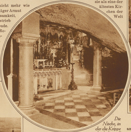
Die Nische, in der die Krippe gestanden haben soll

ches ist zwar nicht mehr wie früher. Aus einstiger Armut erwuchs Regsamkeit, Selbsterhaltungstrieb und Arbeitsfreude. Perlmutter vom Roten Meere, Pechstein vom Toten Meere, Cedernholz vom Libanon wurden den Bethlehemiten wertvoll für eine regsame In-