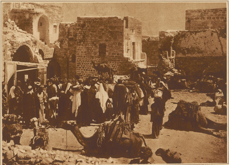
Markttag in Bethlehem