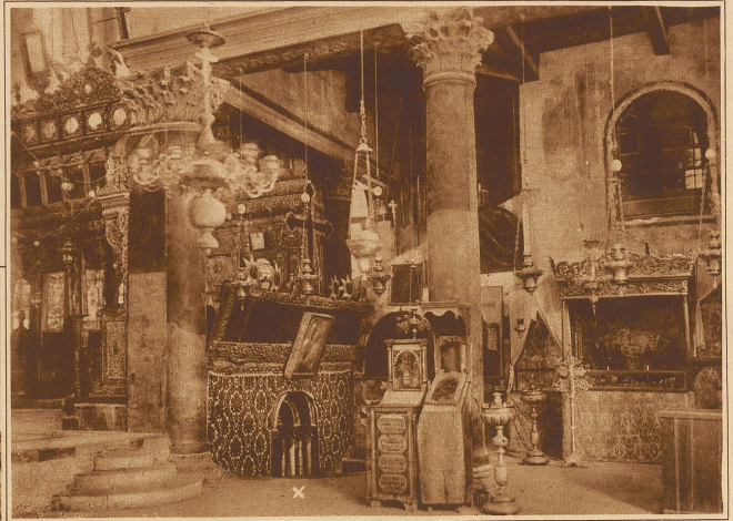
Blick in die Geburtskirche. In der Mitte (X) der Eingang zur Geburtsgrotte

In den dämmernden Kirchen, Kapellen und Klöstern