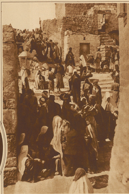
Straßenleben in Bethlehem

in ihr tausendjährige Säulen und Wölbungen aus der Zeit Justinians empor. Balduin wurde einst hier am Weihnachtstage des Jahres 1101