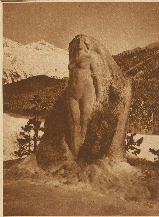
Das Segantini-Denkmal in St. Moritz

Ungern trennt man sich von diesen Stätten. Kindheits Erinnerungen werden wach, liebliches Läuten einer klangvollen Melodie aus einer seltsamen Nacht läutet an diesem Ort. Es ist ein liebhaftes Aufhorchen für jeden, der in den weißen Mauern Bethlehems weilt.