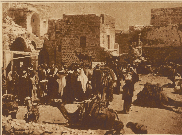
Markttag in Bethlehem

In den dämmernden Kirchen, Kapellen und Klöstern