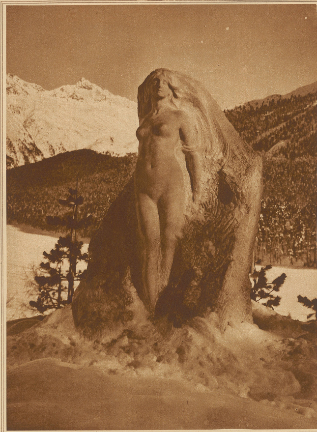
Das Segantini-Denkmal in St. Moritz