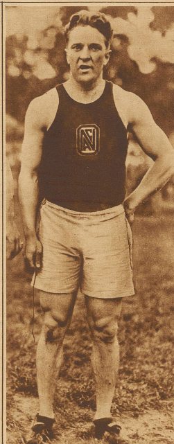
LOREN MURCHISON, der erfolgreiche amerikan. Kurzstreckenläufer, ist an den Folgen einer Blutvergiftung gestorben. Murchison bestritt seinerzeit auch den Endlauf über 100 m anlässlich der Pariser Olympiade