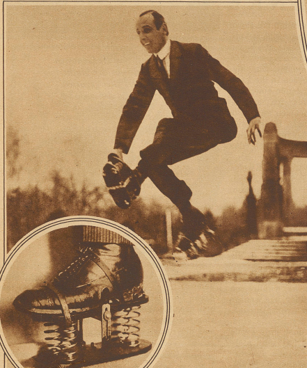
„Siebenmeilenstiefel“, ein neues Spiel- und Sportgerät. Das Bild zeigt den Erfinder bei der praktischen Vorführung