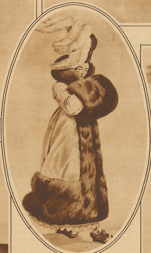
Eine Eisläuferin um die Mitte des vorigen Jahrhunderts