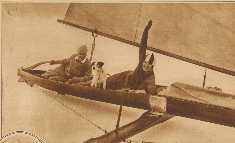
Ein Eissegelschlitten in voller Fahrt