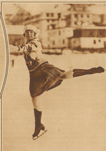
Das Eislauferkostüm der heutigen Generation