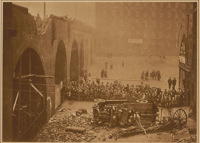
Schweres Unglück einer Motorsprize. Auf rascher Fahrt zu einem ausgebrochenen Großfeuer stürzte in Stockport (England) die erste Motorsprize über die Wellington-Brücke hinunter. Mehrere Feuerwehrleute wurden getötet oder schwer verletzt