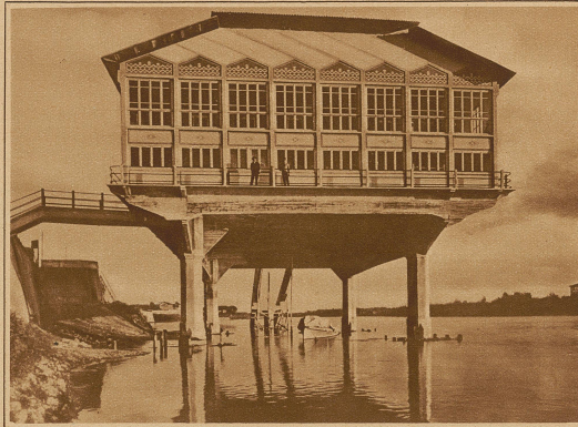
Der neueröffnete Hangar für den Wasserflugzeugverkehr am Ticino-Fluß in Pavia. Sein eigenartiger Bau mutet wie ein riesiger Taubenschlag an