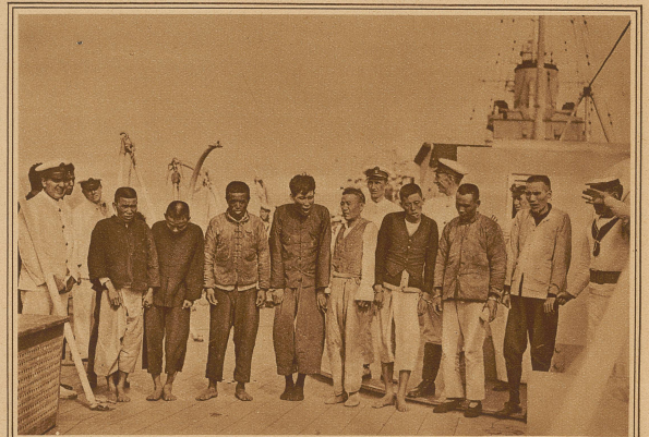
Eine Gruppe gefesselter Piraten