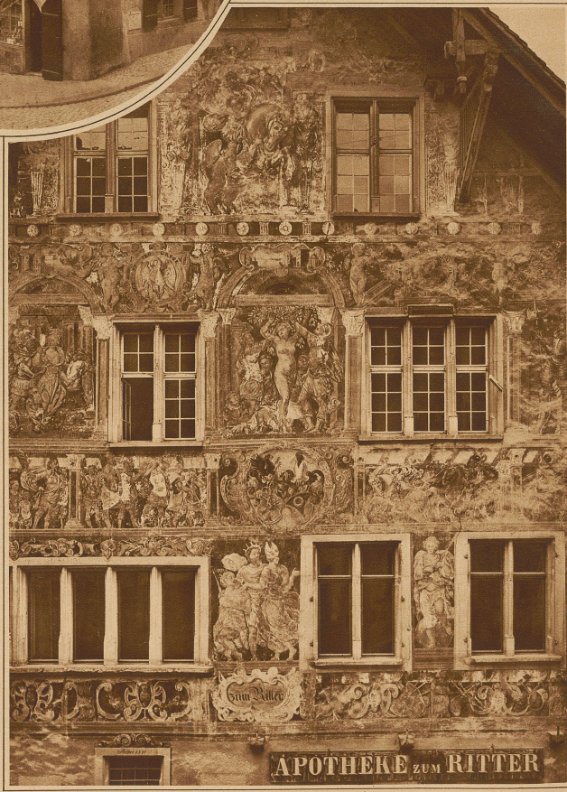
APOTHEKE ZUM RITTER

ein spätgotischer Bau von mächtigen Dimensionen, enthält an der Fassade wertvolle Malereien allegorischen Charakters, die von Tobias Stimmer im Jahre 1570 vollendet wurden. Leider sind diese prächtig hingeworfenen Bilder einer rasch fortschreitenden Zerstörung ausgesetzt, da trotz mehrfacher Versuche bisher wenig oder gar nichts zu ihrer Erhaltung unternommen wurde. In den letzten zwanzig Jahren hat die Verwitterung der Fresken so starke Fortschritte gemacht, daß der Zeitpunkt ihrer völligen Zerstörung nicht mehr fern ist, wenn nicht rasch noch in letzter Stunde sachgemäße Schritte zur Rettung getan werden. Von den beiden Aufnahmen wurde das Fassadenbild im Jahre 1906 und die Gesamtansicht des Hauses zwanzig Jahre später hergestellt. Der Unterschied in der Deutlichkeit der Malereien ist in die Augen springend.