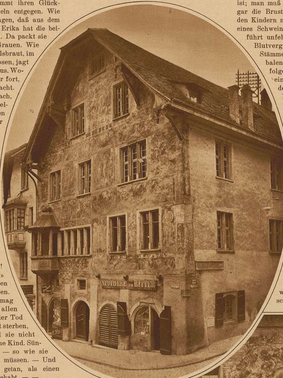
Das Haus „zum Ritter“ in Schaffhausen

ein spätgotischer Bau von mächtigen Dimensionen, enthält an der Fassade wertvolle Malereien allegorischen Charakters, die von Tobias Stimmer im Jahre 1570 vollendet wurden. Leider sind diese prächtig hingeworfenen Bilder einer rasch fortschreitenden Zerstörung ausgesetzt, da trotz mehrfacher Versuche bisher wenig oder gar nichts zu ihrer Erhaltung unternommen wurde. In den letzten zwanzig Jahren hat die Verwitterung der Fresken so starke Fortschritte gemacht, daß der Zeitpunkt ihrer völligen Zerstörung nicht mehr fern ist, wenn nicht rasch noch in letzter Stunde sachgemäße Schritte zur Rettung getan werden. Von den beiden Aufnahmen wurde das Fassadenbild im Jahre 1906 und die Gesamtansicht des Hauses zwanzig Jahre später hergestellt. Der Unterschied in der Deutlichkeit der Malereien ist in die Augen springend.