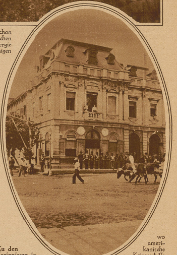
Zu den Ereignissen in Nicaragua. Unser Bild zeigt das Zentrum der Unruhen, die Stadt Managua, wo amerikanische Kriegsschiffe gelandet sind. Vor dem Gebäude stehen Soldaten der Partei des Präsidenten Diaz