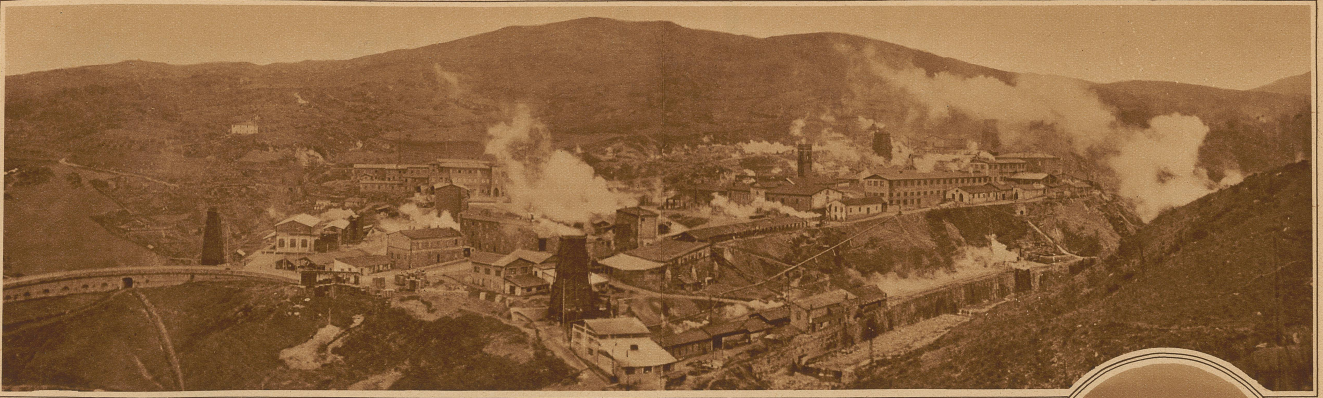
In der Nähe des uralten Städtchens Volterra in der Toscana entströmen auf einem ausgedehnten Gebiete heiße Schwefeldämpfe der Erde. Diese weiße Kohle der Technik nutzbar zu machen, war schon lange das Bestreben italienischer Fabrikbetriebe, die sich seit der erfolgten Lösung des Problems zu Dutzenden dort angestellt haben. Es ist gelungen, die im natürlichen Dampf enthaltenen chemischen Bestandteile (vor allem Schwefelamoniak und Borax) zu entziehen, so daß nun der unter drei Atmosphären Druck ausströmende Dampf auf direktem Wege zur Erzeugung elektrischer Energie verwendet werden kann. Durch weiteres Anbohren der unterirdischen Dampfzonen wird es möglich sein, beliebig viele neue Quellen zu erschließen. Unser Bild zeigt die glückliche Ortschaft mit einigen von Erddampf getriebenen Fabriken