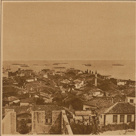
Blick auf die albanische Stadt Durazzo, die letzte Woche durch ein Erdbeben teilweise zerstört wurde