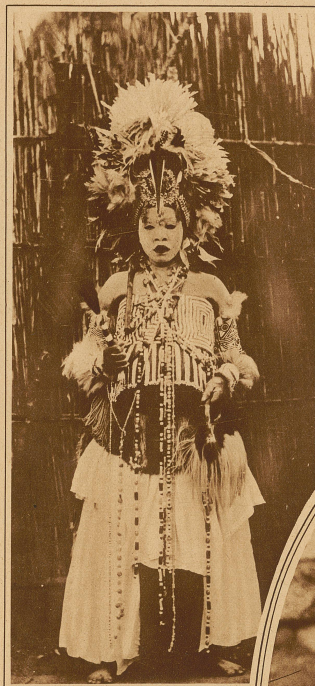
Geschminkte Negerin im Festkostüm

Lieblingsfarbe, und auf den wertvollsten und schönsten Stoffen sind nach Art einer illustrierten Zeitung ganze Bilderfolgen gedruckt. Aber die wirklichen, produktiven Modeinfälle liegen in den Frisuren. Man könnte ein ganzes Werk mit Bildern über die phantastischen, bewundernswerten Einfälle der Neger füllen. Die einen formen unter Zuhilfenahme von Lehm richtige steile Hüte aus dem Haar, andere zaubern aus Haarbüscheln förmliche Blumenbeete auf ihren Köpfen hervor. Bei allen aber spielt das Rasieren die Hauptrolle, denn das kurze wollige Negerhaar ist mit dem unsrigen nicht zu vergleichen. Und wie man rasiert! Die Haut eines Negers, der ja auch nie einen Tropenhelm braucht, hat ein wesentlich anderes Pigment wie die unsere. Sie ist weich wie Samt, aber doch zäh wie Leder. Und so besteht der beliebteste Rasierapparat aus geschliffenen Steinen oder geschärften Konservendbüchsen.