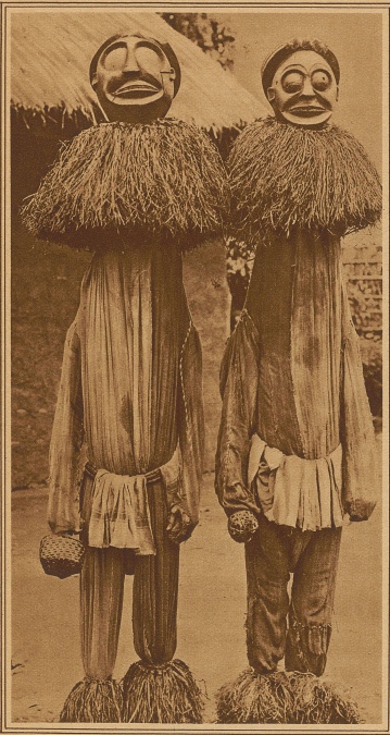
Tanzmasken aus Kamerun

Schönheitsbegriffe sind relativ. Sie wechseln räumlich und zeitlich, mit Völkern und Jahrzehnten. Monate können Anschauungen von Grund auf verändern, und was hier als selbstverständlich gilt, das wird ein paar Kilometer weiter