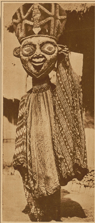
Tanzmaske der Bamun in Kamerun

versucht es mit Tätowieren und Schminken, oder richtiger, mit Anstreichen und Bemalen. Fuß- und Handgelenke werden mit Federbüscheln geschmückt, Schnüre mit aufgereihten Tierknochen, getrockneten Früchten oder Metallschellen um den Körper gebunden, die ein unheimliches Klappern verursachen. Denn darüber ist man sich in ganz Afrika klar: Freude und Lärm ist ganz das gleiche. Ein