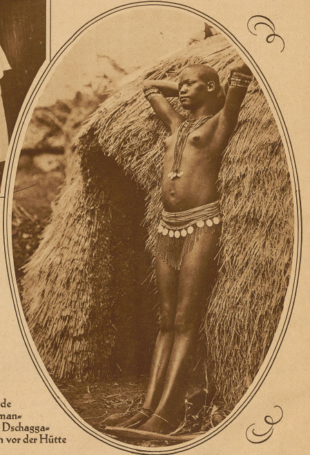
Die Mode am Kiliman- dscharo. Dschagga- mädchen vor der Hütte

Lieblingsfarbe, und auf den wertvollsten und schönsten Stoffen sind nach Art einer illustrierten Zeitung ganze Bilderfolgen gedruckt. Aber die wirklichen, produktiven Modeinfälle liegen in den Frisuren. Man könnte ein ganzes Werk mit Bildern über die phantastischen, bewundernswerten Einfälle der Neger füllen. Die einen formen unter Zuhilfenahme von Lehm richtige steile Hüte aus dem Haar, andere zaubern aus Haarbüscheln förmliche Blumenbeete auf ihren Köpfen hervor. Bei allen aber spielt das Rasieren die Hauptrolle, denn das kurze wollige Negerhaar ist mit dem unsrigen nicht zu vergleichen. Und wie man rasiert! Die Haut eines Negers, der ja auch nie einen Tropenhelm braucht, hat ein wesentlich anderes Pigment wie die unsere. Sie ist weich wie Samt, aber doch zäh wie Leder. Und so besteht der beliebteste Rasierapparat aus geschliffenen Steinen oder geschärften Konservendbüchsen.