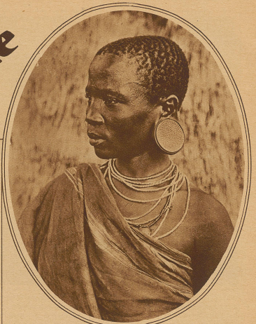
Ohrschmuck eines Deshaggamannes. Das Ohrplättchen wird so lange bearbeitet, bis es eine verzierte Holzscheibe zu umschließen vermag

Einzug gehalten und auch in den vergessenen Negerdörfern des belgischen Kongo kennt man die in der Mitte durchlochten Fünf- oder Zehncentimesstücke, die, an einer Schnur aufgereiht, als «Ring Geld» für die Negerherzen den Inbegriff des Erstrebenswerten, des Reichtums, des