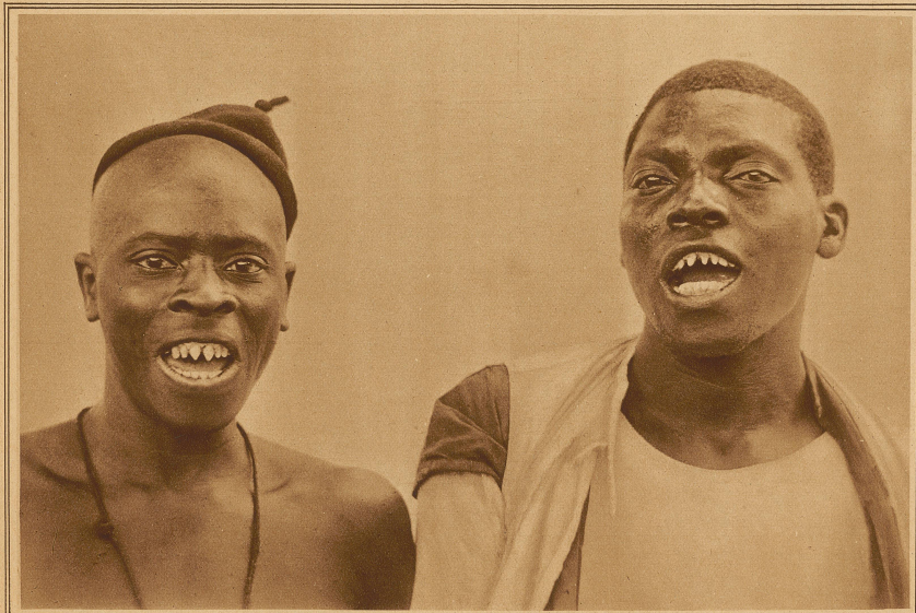
In Ostafrika, gelten spitz gefeilte Zähne als besonders schön

Tausenderlei Ideen könnte man noch anführen, denen die Neger auf ihre originelle Weise Gestalt geben. Wir wollen uns mit den angeführten begnügen und in ihnen nicht nur Scherz, Ironie und Satyre, sondern auch Ernst und tiefere Bedeutung suchen. Es hat seinen guten Grund, weshalb Afrika, afrikanische Sitten und afrikanische Kunst seit einigen Jahren weit über den Rahmen von Museen und Wissenschaften hinaus das Interesse der europäischen Allgemeinheit auf sich gelenkt hat. Dieses Afrika, dieser unerschöpfliche Born ursprünglicher Einfälle befriedigt nicht nur den Kitzel eines nach Exotik dürstenden Jahrhunderts. Es schafft durch das Primitive ein Prinzip, auf dem sich unsere eigene Leistung aufbauen kann. Es greift mitten in unsere Zeit und führt sie den Weg zur Ursprünglichkeit.