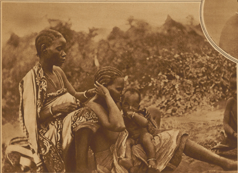
Das Vorbild unseres Bubikopfes. In das Haar werden kunstvolle Streifen einrasiert