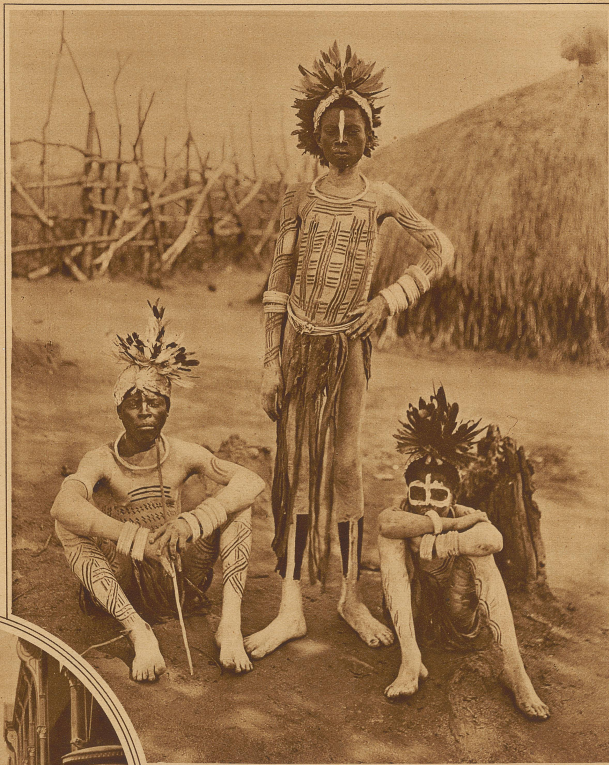
Dikarjünglinge täuschen durch Bemalen der Haut Kleider vor

diese Kette... davon können die Forscher erzählen! Bis vor kurzem waren die Perlen überall das Tauschmittel, der Ersatz für Geld, und wehe, wenn die Mode gewechselt hatte und man statt der kleinen gelben nur noch große, rote Perlen nahm. Die Karawane hätte elend verhungern müssen, wenn es nicht gelang, die Aufmerksamkeit der «Waschens» auf einen andern Gegenstand zu lenken. / Heute ist das anders. Der allmächtige Sixpence hat überall seinen