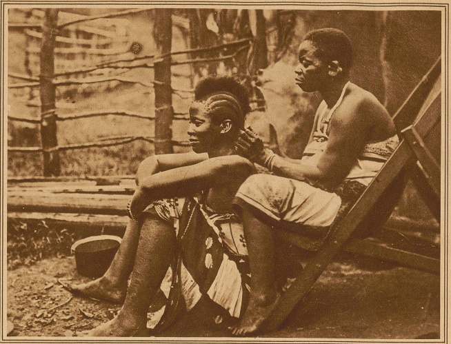
Die ostafrikanische Raupenfrisur

Ueber eins sind sich die Neger einig: grell, groß und auffallend muß alles sein, was sie auf dem Leib haben. Den gleichen Geschmack weisen auch die «Kostüme» auf, die jetzt überall eingeführt werden. In der Farbe und in den Mustern feiert ihr primitiver Geschmack wahre Orgien. Besonders die Kleider der Negerfrauen am Rande der Zivilisation sind eine Augenweide für jeden, der Sinn für gesunden Kitsch hat. Grün ist verhasst, Rot ist die