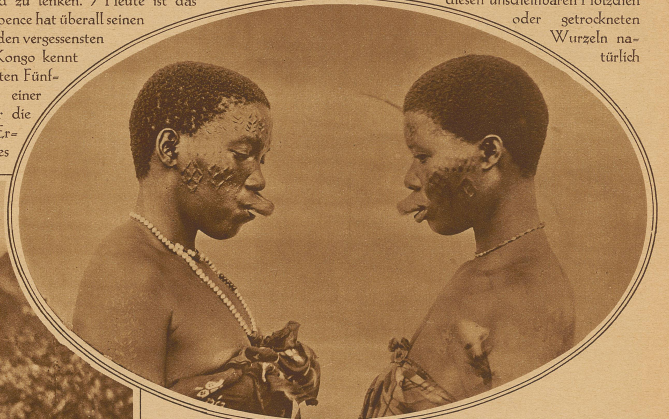
Märtyrer der «Schönheit».

Mit Perlen und Geldstücken ist aber erst ein winziger Bruchteil jener zahllosen Gegenstände genannt, mit denen sich der Neger behängt. Selbstgefertigte Ketten aller Art, seltsam geformte Steine und vor allem die aus einem ausgehöhlten, kunstvoll geschnittenen Holzchen bestehenden Schnupftabakdosens fehlen nur bei wenigen Stämmen. Die größte Rolle aber spielen die rituellen Schmuckstücke, die Fetische, denen man irgendeine besondere heilige Wirkung zuschreibt. Außerlich ist diesen unscheinbaren Holzchen oder getrockneten Wurzeln natürlich