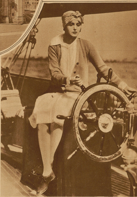
Eine Corinne Griffith am Steuer ihrer Jacht. Eine der beliebtesten amerikanischen Schauspielerinnen, die Gattin des weltbekannten Regisseurs und Schauspielers Griffith, ist mit ihrer Jacht nach San Pedro gefahren