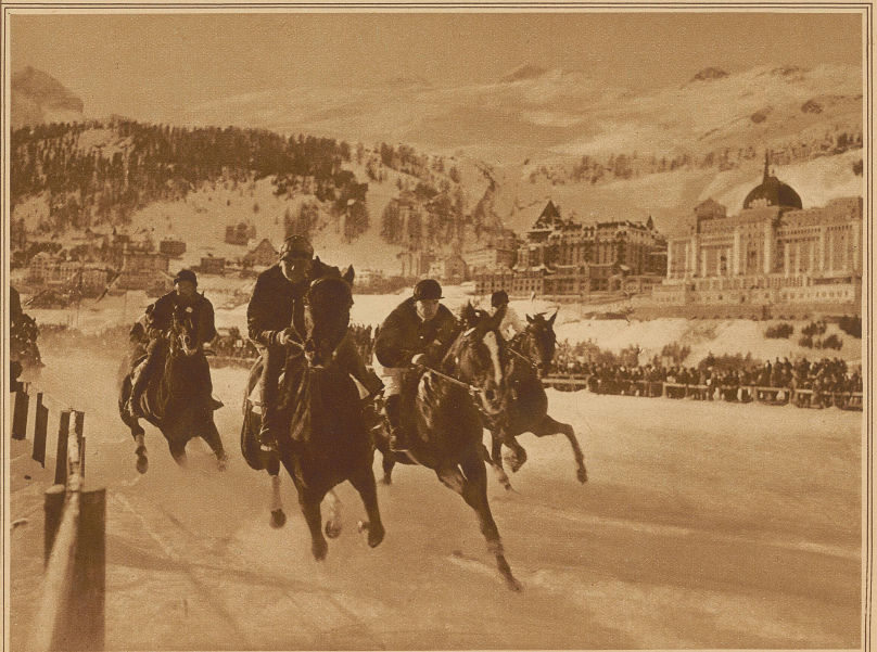
Das geschlossene Feld im «Preis von Zürich». Sieger: «Etrurie»