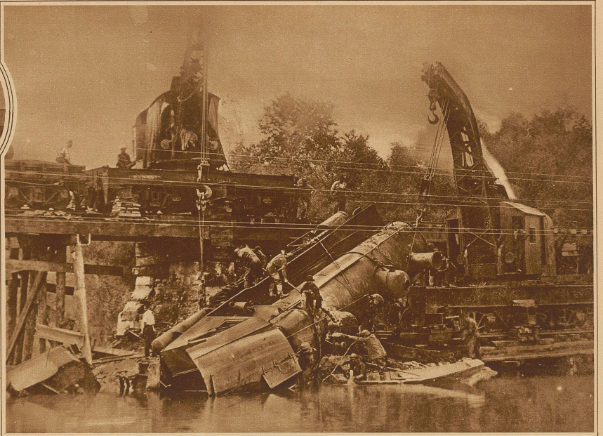
Bergung eines in den Fluß gestürzten Eisenbahnzuges mittels Kran