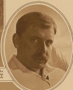
Othmar Schoeck der bekannte Komponist, dessen neueste Oper «Penthesilea» mit großem Erfolg an der Staatsoper in Dresden aufgeführt wurde