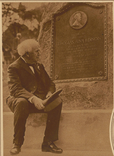
Thomas Alva Edison, der sich vom Zeitungsjungen zum größten Erfinder entwickelte, feiert am 11. Februar seinen 80. Geburtstag. Unser Bild zeigt ihn vor der Gedenktafel, die ihm schon zu Lebzeiten errichtet wurde