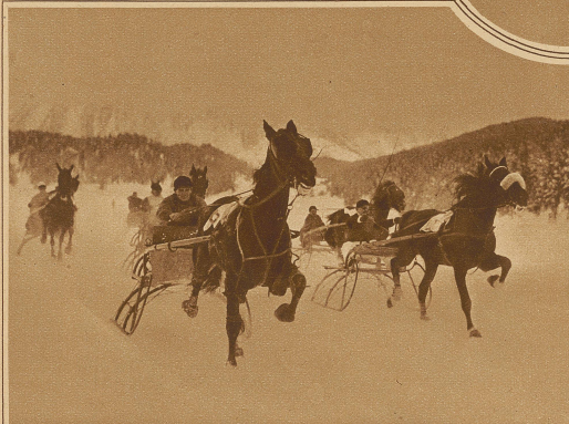
Momentbild aus dem Trabrennen um den «Preis von Graubünden»