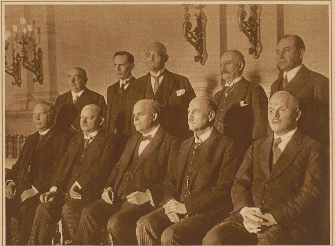
Das neue deutsche Kabinett: Von rechts nach links, sitzend: Dr. Geßler, Vizekanzler Hergt, Reichskanzler Dr. Marx, Dr. Stresemann, Dr. Brauns; stehend: Dr. Curtius, Schiele, Dr. Köhler, Dr. von Keudell und Dr. Koch